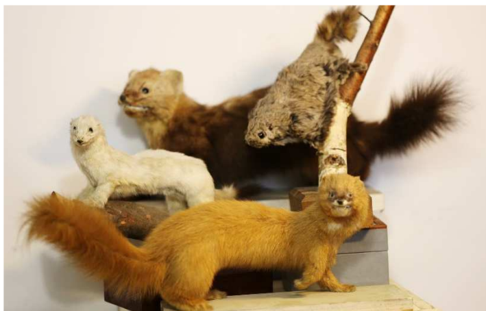
Рис. 6. Опудала звірів з колекції митрополита Йосифа Сліпого.

Спосіб виготовлення теж залишає бажати кращого. На частині експонатів помітно, що preparator не мав фахової освіти (особливо з анатомії тварин), рідко займався виготовленням опудал і не мав належних інструментів і препаратів. Хоча пози, в яких відтворено експонати, свідчать про спостережливість preparatora і знання поведінки тварин, яких він опрацьовував. Натомість дятли (звичайний Dendrocopos major , білоспинний Dendrocopos leucotos і жовна сива Picus canus ) виготовлені настільки професійно, що навіть використовувалися раніше для оформлення стаціонарної експозиції музею і виставок.