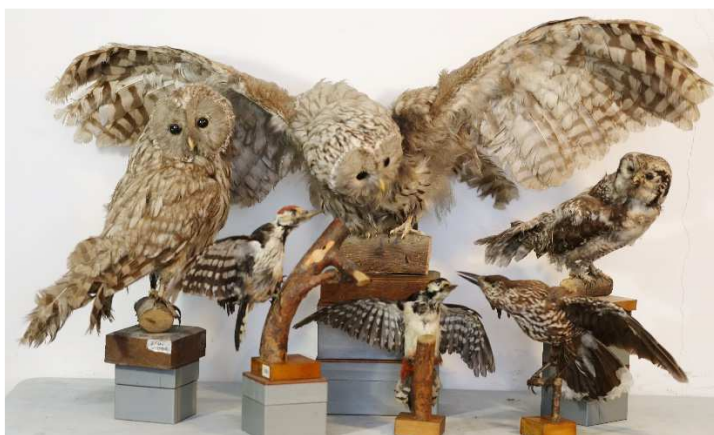
Рис. 5. Орнітологічна частина колекції митрополита Йосифа Сліпого.