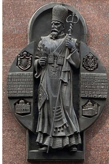
Рис. 1. Пам'ятна таблиця з барельєфом митрополита Йосифа Сліпого на вул. Коперника у Львові.

Проте серед колекторів є одна непересічна особистість, яку також варто згадати, незважаючи на те, що її вклад становить лише 8 опудал птахів і 5 ссавців, ймовірно здобутих і виготовлених власноруч. Це Йосиф Іванович Сліпий – український церковний діяч, єпископ Української греко-католицької церкви, кардинал католицької церкви, Верховний Архієпископ Львівський – предстоятель Української греко-католицької церкви (рис. 1).