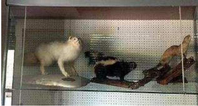
Рис. 2. Експонати природничого музею біля Собору Святої Софії у Римі.

екзотичних представників місцевої флори і фауни. Єпископа в Австралії Івана Прашка, який свого часу був його студентом у Львові, він зокрема попросив надіслати йому кенгуру. Владика всіляко відговорював Патріарха, пояснюючи, що австралійські закони досить суворі в таких питаннях, однак Йосиф Сліпий добився свого, отримавши кенгуру і навіть качкодзьоба, якого переслали йому в забальзамованому стані.