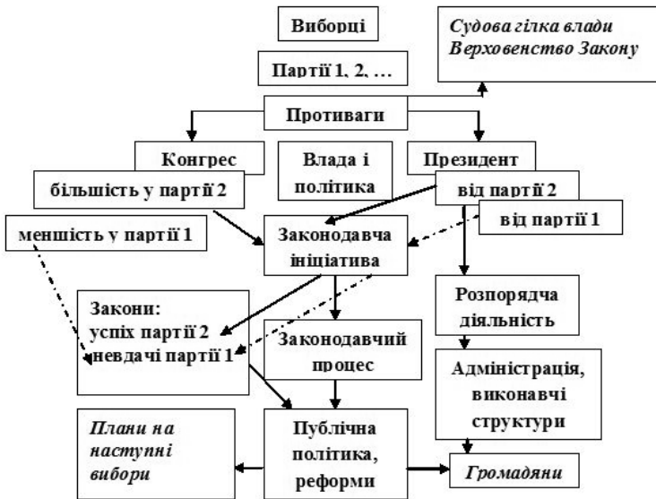
Рис. 2. Президентська форма правління як система взаємодії і взаємоконтролю

Президентська форма правління (або «президентизм») як правління до цієї форми) умовно представлена на рис. 2.