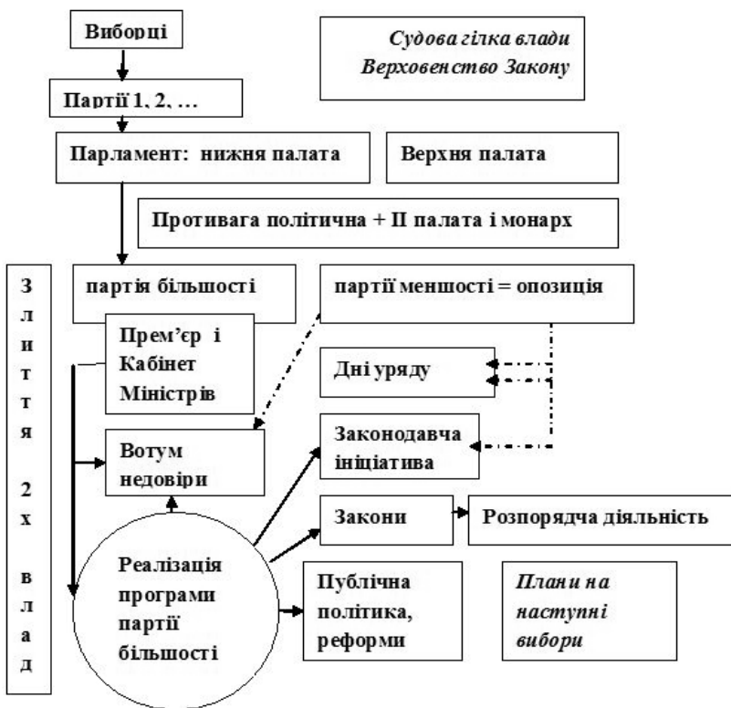
Рис. 3. Парламентська форма правління як система залежності

влади, а нижньої палати на головну арену законодавчої діяльності вирішальним фактором демократичного правління стає наявність сильної, інституціалізованої опозиції або, іншим словами, політичний розподіл влади. Саме політичний розподіл, базований на чітко структурованій партійній системі, є головним інституційним запобіжником від узурпації влади однією політичною силою та її «вождем», компенсуючи відсутність жорсткого поділу повноважень між гілками влади, притаманного президентським демократіям.