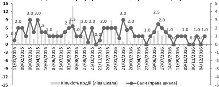
Рис. 2. Динаміка реформ системи державного управління

Процеси дерегуляції. Поряд з реформами системи державного управління слід відзначити низку реформ, які не стосуються її безпосередньо, однак їх проведення створює певний інституційний простір, який позитивно впливає на функціональність системи державного управління. Йдеться про «зменшення кількості держави» у суспільно-політичних і фінансово-економічних процесах. З-поміж таких реформ найбільш важливою, на наш погляд, є перехід з 1 серпня 2016 р. на систему електронних закупівель ProZorro, відповідно до Закону «Про публічні закупівлі [15]». На цю систему закупівель переведено центральні органи влади, великі державні підприємства і природні монополісти, місцеві органи влади, комунальні підприємства й інші організації, які використовують кошти платників податків. Повний перехід на електронну систему означає, що всі тендери, які перевищують порогові значення, повинні проводитись через ProZorro. Державний замовник (орган влади, державне чи комунальне підприємство) повинен завантажувати в ProZorro тендерні заявки, оголошуючи таким чином закупівлю. Далі він відповідає на питання постачальників і проводить в електронній системі аукціон чи іншу процедуру, передбачену Законом «Про публічні закупівлі». Після визначення переможця замовник зобов'язаний також завантажити в систему текст договору з постачальником. А завдяки інтеграції з порталом Є-Data і проектом віднедавна в ProZorro також можна відслідкувати ще й оплату договору, якщо вона здійснюється Державним казначейством України.