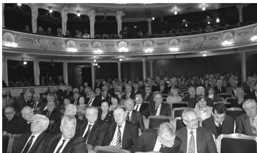
Збори наукової громадськості регіону у Львівському національному академічному театрі опери та балету ім. Соломії Крушельницької.

Тут діють п'ять регіональних наукових центрів подвійного з Міністерством освіти і науки України підпорядкування: Донецький (Покровськ), Західний (Львів), Південний (Одеса), Північно-східний (Харків), Придніпровський (Дніпро), а також Центр оцінювання наукових установ та розвитку регіонів (Київ). Західний науковий центр (ЗНЦ) НАН України і МОН України об'єднують науковців восьми західних областей: Волинської, Івано-Франківської, Закарпатської, Львівської, Рівненської, Тернопільської, Чернівецької та Хмельницької. Нині тут функціонують 22 установи НАН України, три державні підприємства, більше 80 закладів вищої освіти, понад 50 галузевих науково-дослідних організацій, в яких працює понад 26 тисяч наукових і науково-педагогічних працівників, серед яких більше 2500 докторів і 14000 кандидатів наук. В установах НАН України Західного регіону сьогодні трудиться біля 2300 працівників, серед яких понад 1200 науковців, 12 академіків і 26 член-кореспондентів НАН України, які примножують здобутки Академії.