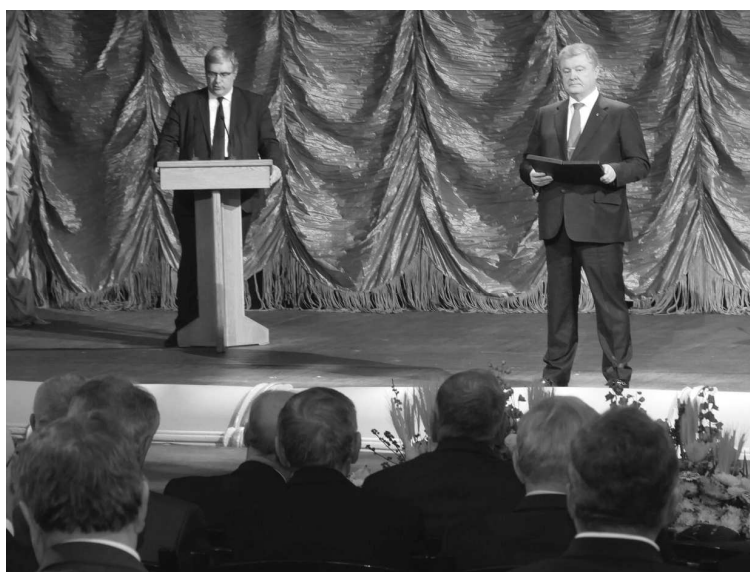
Виступ Президента України Петра Порошенка на Ювілейній сесії Загальних зборів НАН України.

Редакція журналу з приємністю вітає кожного працівника Академії, який віддає свої сили і насагу для продовження і примноження традицій української науки. Нехай Ваша щоденна праця буде пошанована, а знання, які Ви поширюєте серед своїх співвітчизників, проростають і дають плоди у вигляді інновацій і нових технологій. Бажаємо всім Вам міцного здоров'я та нових творчих здобутків.