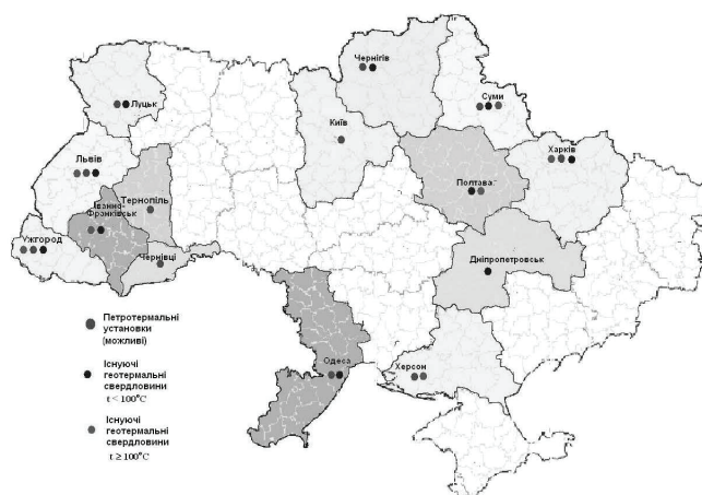
Рис. 2. Регионы Украины перспективные для развития геотермальной энергетики.

В Украине технически возможный потенциал использования геотермальной энергии составляет 53,58 млн. МВт·часов и сосредоточен, главным образом, в Закарпатской, Прикарпатской, Полтавской, Харьковской областях. Этот потенциал позволяет реализовать мощности по производству тепловой энергии в объеме 12,4 ГВт и электроэнергии в 414 МВт.