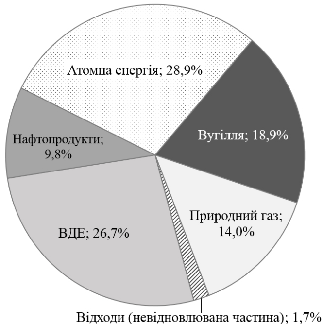
Рис. 2. Структура виробництва первинної енергії в ЄС-28, 2015 р. (загалом 766,6 млн. т н.е.) [6].

Із загального обсягу біомаси/біопалив, що споживаються в ЄС (136,2 млн. т н.е./рік), найбільша частка (82,9 млн. т н.е./рік або 61%) використовується для виробництва теплової енергії. Решта ділиться приблизно порівно між виробництвом електроенергії і біопалив для транспорту. Найкрупнішими споживачами теплової