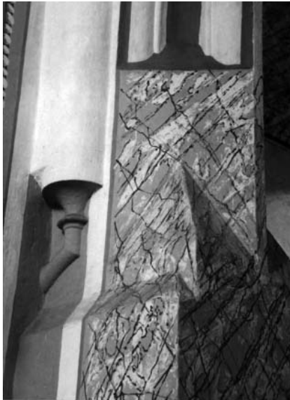
Колінчаста консоль склепіння пресбітеріуму дозволяє впевнено говорити, що вони витесані в одній майстерні.

Обидва об'єкти поєднують, насамперед, спільні форми порталів. У Великих Берегах західний портал має профіль, що складається з двох жолобків і двох виступів – півкруглої та грушоподібної форми. Обидва виступи мають унизу цоклі, причому один із них повторює форму виступу в дещо збільшеному вигляді, а другий, теж розширений, оформлений канелюрами. В місцях переходу додано горизонтальні пояски.