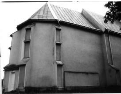
Північний фасад пресбітеріуму

Останньою роботою М. Хнаба вважається нава костюлу Марія ам Гештаде. Тут він зводив навовий корпус. Саме під час будівництва цього костюлу