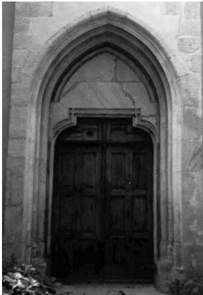
Північний портал костюлу у Береговому

цехів. Цікаво, що за віденським, окрім території Австрії, закріплювалася територія всього Угорського королівства [13].