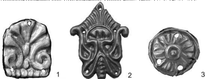
Рис. 3. Аплікації з рослинними мотивами: 1-2. к. 4 біля с. Новосілки, 3. к. біля с. Будки.

Пластини із зображенням пальмет двох варіантів знайдені в кургані № 4 поблизу с. Новосілки IV ст. до н.е. Перший – пласкі пластини овальної форми у вигляді дев’ятипелюсткової пальмети (11 екз.). Бокові пелюстки загнуті на кінцях у середину, середні розширюються догори. Пальмета розміщена на стрічці, заповненій рельєфним орнаментом у вигляді опуклих крапок (Рис. 3.1). Розміри 20×22 мм. Близька іконографія простежується на пластинах V ст. до н.е. з кургану Сім Братів № 3 (Кубань); на пластинах IV ст. до н.е.: з Мелітопольського кургану; кургану поблизу с. Шульгівка Запорізької обл.; кургану Бабина Могила та на прикрасах горита з Соболевої Могили Лніпропетровської обл. (Мозолевский. Полин 2005. табл. 17. 4: 12. 37–39).