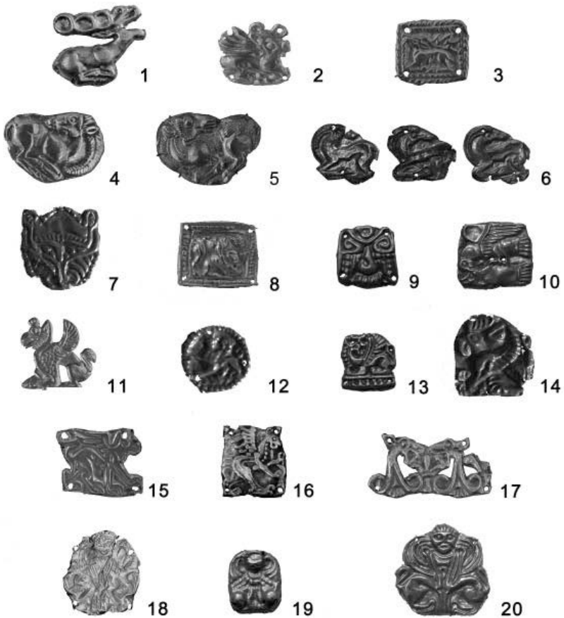
Рис. 1. Аплікації з зооморфними зображеннями: (1-3 - оленя; 4-6 - гірського козла; 7 - морди хижака; 8 - сцени терзання; 9 - птахи; 10 орла, що клеє рибу; 11-16 - грифона; 17- зооморфно - рослинними мотивами; 18-20 сфінкса).

1. к. 35 біля с. Бобрця; 2. к. 1 біля с. Жаботин; 3. к. 11 біля с. Пруси; 4. к. 100 біля с. Синявка; 5. к. 4, п. 2, ур. Галушино; 6. к. біля с. Будки; 7. к. 14 біля с.м.т. Стеблів; 8. к. 1 біля с. Вовківці; 9. к. 4 біля с. Новосілки; 10. к. 2, ур. Галушино; 11. к. Переп'ятиха біля с. Марьяновка; 12. к. 14 біля с.м.т. Стеблів; 13. к. 4 біля с. Новосілки; 14. к. біля с. Бубнова Слобода; 15-17 – к. біля с. Будки; 18, 19. к. 4 біля с. Новосілки; 20. к. 2, ур. Галушино.