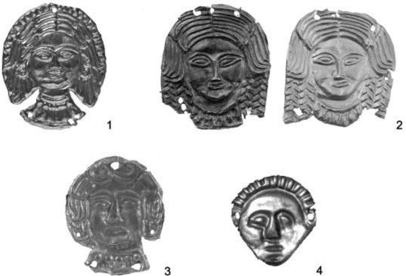
Рис. 2. Аплікації з антропоморфними зображеннями: 1-2 - к. 1 біля с. Вовківці; 3 - к. біля с. Будки; 4. к. 2, ур. Галуцино.

Подібна схема зображення простежується й на пластинах (12 екз.) з кургану поблизу с. Будки Сумської обл. IV ст. до н.е. (Ханенко, Ханенко 1899, с. 7, 31, табл. XXV, 420). На них зображена жіноча голова в фас, із мигдалеподібними очима і пишною зачіскою, яка розділена на короткі хвилясті пасма. На шії гривна і намисто з великих намистин (Рис. 2.3). Розміри 25×30 мм. Дещо подібні зображення з Бердянського кургану Запорізької обл. IV ст. до