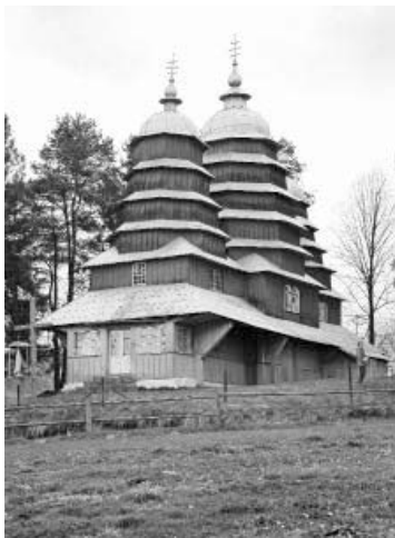
Церква Собору Пресвятої Богородиці у с. Матків, Львівської обл. 1838 р.

поступається верху нави. Широке піддашшя, що переходить в дахи вівтаря та бабинця, оперізує всю споруду. Виявлені триверхність і ритм горизонтальних членувань свідчать про бойківський тип храму, але каркасна вежа над бабинцем – це жест у бік тенденцій лемківської школи.