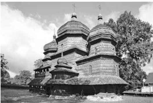
Церква Святого Юрія в м. Дрогобич Львівської обл. Початок XVI ст.

ікони «Старозавітна трійця» та «Зішестя Святого Духа». Наступні три яруси празниковий, апостольський і пророчий – по 6 з кожного боку від центру, на одну ікону зміщуються на бічні стіни. Празникові ікони утворюють своєрідний фриз, який слугує основою для ритмічного ряду видовжених в арочних окресленнях постатей апостолів. Завершується