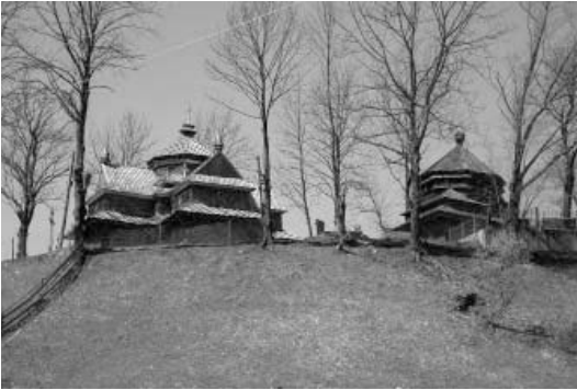
Вознесенська (Струківська) церква в с.мт Ясіня Закарпатської обл. 1824 р.

Узагальнюючи дані про вище розглянуті пам'ятки, слід звернути увагу на ще один важливий критерій відбору – на їхню унікальність і самобутність як утілення традицій народного храмобудування. Своєрідністю форм і відлунням давнини храмові споруди уже давно почали привертати увагу шанувальників старожитностей та науковців [4].