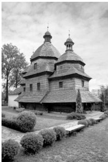
Церква Пресвятої Трійці в м. Жовква Львівської обл. 1720 р.

Розписи південної стіни нави храму вціліли частково. Краще, зокрема, збереглася розміщена вверху в центрі сцена «Богоматір Печерська зі святими Антонієм та Феодосієм», по боках від неї – архангели. У нижньому ярусі