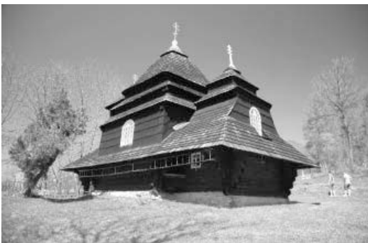
Церква Архангела Михаїла в с. Ужок Закарпатської обл. 1745 р.

тер внутрішнього середовища храму значною мірою організує вишуканий, сяючий позолотою, традиційний за структурою іконостас. Різьблені Царські врата з мотивами виноградної лози, грон винограду та медальйонами прикрашають вхід до вівтаря. Над ними знаходиться варта уваги ікона «Деїсус» і при-