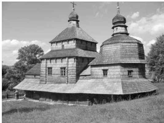
Церква Святого Духа в с. Потелич Львівської обл. 1502 р.

прикордонних територіях Підкарпатського і Малопольського воєводств Польщі. Зокрема, від української сторони відібрані для занесення до списку Світової спадщини церкви Святого Духа в с. Потелич Львівської обл., Пресвятої Трійці в м. Жовкві, Святого Юрія в м. Дрогобичі, Собору Пресвятої Богородиці в с. Матків Львівської обл., Святодухівська в м. Рогатині, Різдва Пресвятої Богородиці в с. Нижній Вербіж Івано-Франківської обл., Вознесенська (Струківська) церква в смт. Ясіня, церква Архангела Михаїла в с. Ужок Закарпатської обл.