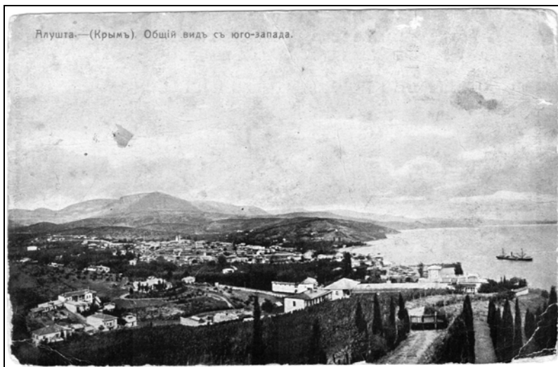
Крым : Алушта : общий вид с юго-запада : [открытое письмо]. – Стокгольм : акц. о-во «Гранберг», [после 1904].