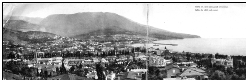
[№ 2] : [Ялта] : [панорама] : [печатное]. – Стокгольм : акц. о-во «Гранберг», 1916.