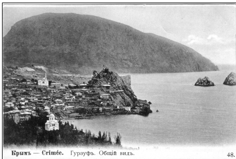
[№ 48] : Крым : [Гурзуф] : общий вид : [открытое письмо]. – [Стокгольм] : [изд-во «Ернст Г. Сванстрем»], [после 1904]