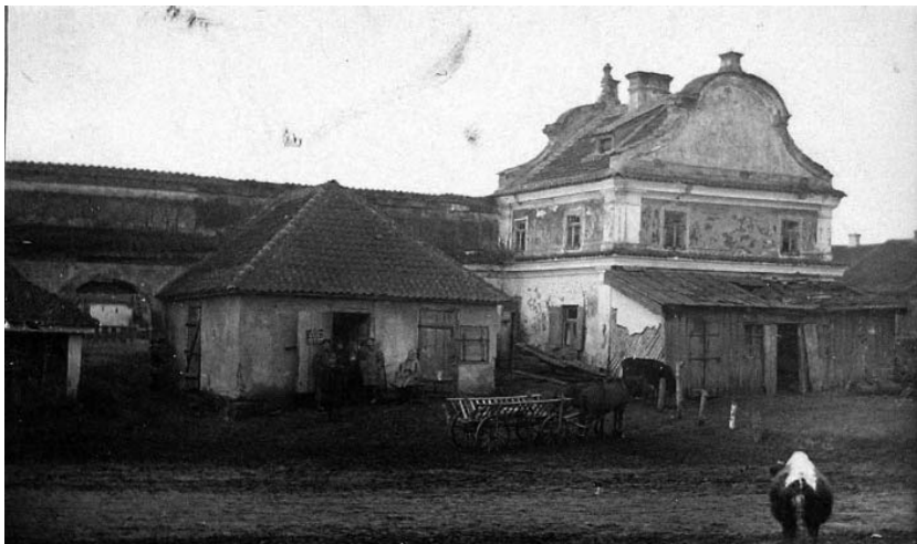
Рис. 5. Заслав. Ратуша. Фото Павла Жолтовського (1928 або 1929 р).

Локалізуванню торгових рядів XVIII ст., що не збереглися, є складним завданням. Підказкою може слугувати характерна форма у вигляді витягнутого прямокутника, та існуючий костел, що був до них «Ближе всего». На архівних планах міста (іл. 4), простежується прямокутний у плані елемент забу-