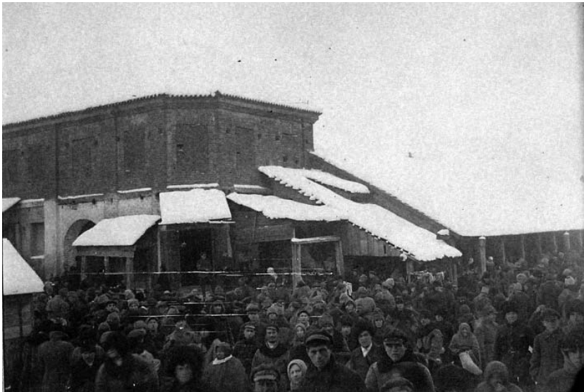
Рис.2. Ізяслав. Будинок на вул. Заславська, 33. (1928 або 1929 р).

молодшої гілки роду Острозьких, і пов'язане з цим становлення їх головної княжої резиденції, торкаються документи з архіву князів Сангушків, (зберігається у Кракові). Аналіз цих матеріалів дозволить скласти повніше уявлення про монументальну забудову міста у XVI–XVII ст., до складу якої входили