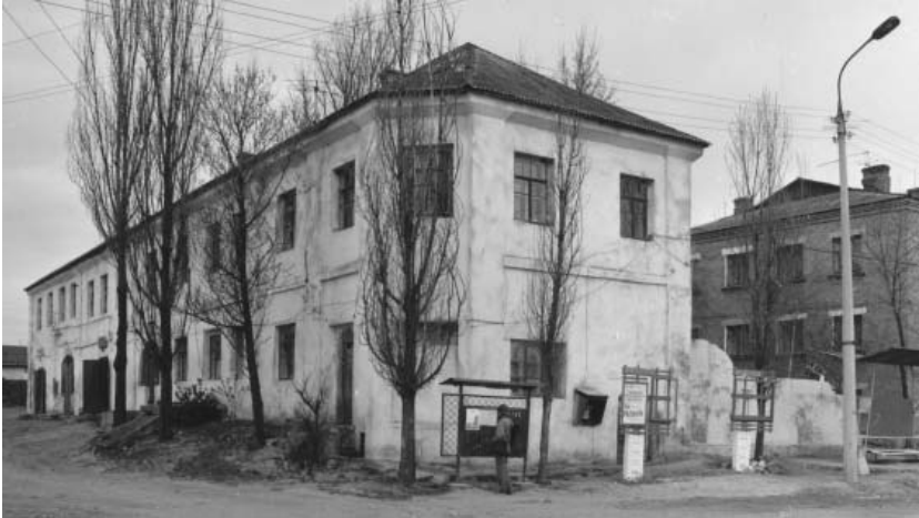
Рис.1. Ізяслав. Будинок на вул. Заславська, 33. Фото з архіву Укрпроектреставрації (1983–1993 роки)