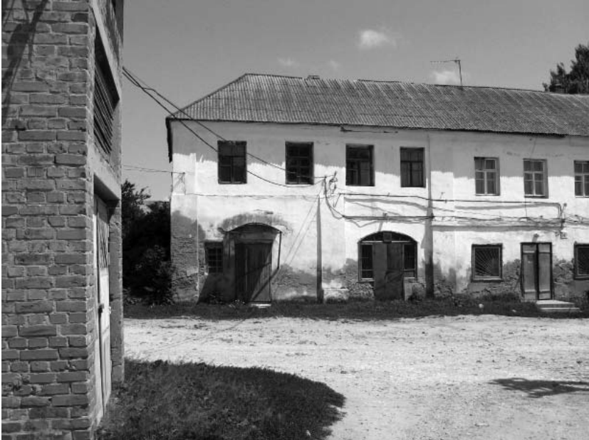
Рис.3. Ізяслав. Будинок на вул. Заславська, 33. Фрагмент. Фото автора (2010 р).

існуючі будівлі костелу, синагоги, скарбниці – стародавні архітектурні домінанти, які поєднують минуле з сучасним. Невід’ємним елементом середньовічного міста була торгова площа – Ринок.