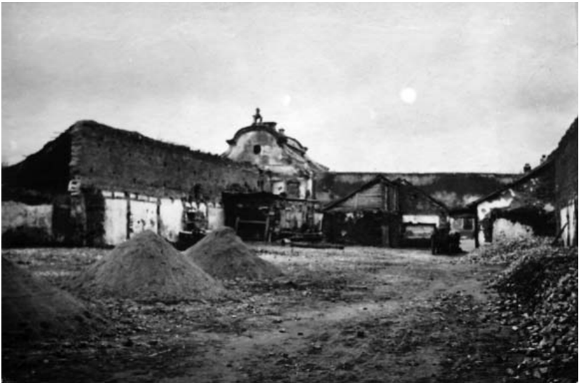
Рис. 6. Заслав. Руїни торгових рядів. Фото 1926 р.

З архівних джерел відомо, що в 1764 р. у Старому Заславі перебудовується ринок, який тепер становив окрему міську ділянку, оточену дерев'яним парканом. В середині ринок поділявся на окремі вулиці з дерев'яними крамницями та мурованими магазинами. [12]. Чи можна видовжені будинки, про які ми згадували, ототожнювати з цими крамницями? Є інший варіант: ринок з ратушею стояв ближче до костелу, а два інші прямокутні будинки – це заїзди, розповсюджені у Заславі (до речі збереглися і деякі фото).