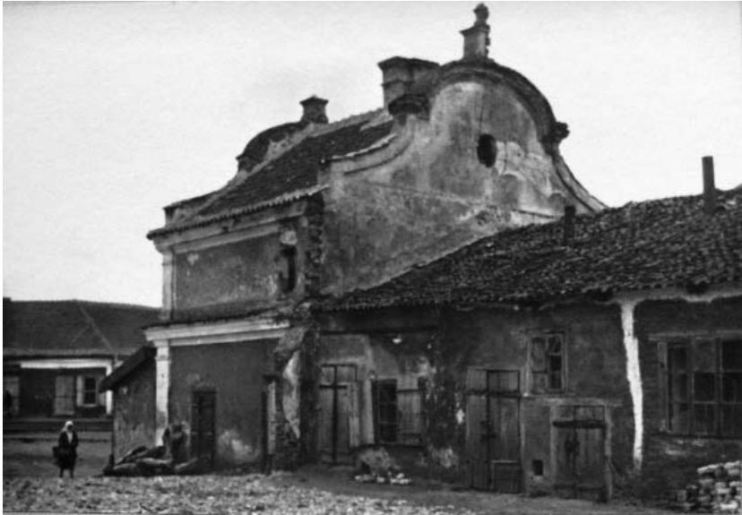
Рис. 7. Заслав. Ратуша. Фото 1926 р.

Повернемся знову до спогадів Павла Жолтовського: «Но вот проезжаем «цегельню», кладбище, въезжаем в «Старый город». Сначала у дороги мещанские усадьбы, мало чем отличающиеся от сельских хат, потом вас обступили местечковые дома, тесно скученные, без заборов, дворики. Деревянные каркасные, наполненные глиной, побелённые стены, черепичные крыши. Вот центральная площадь, замощенная глянцевым, истертым булыжником. В ярмарочные дни здесь тесно от возов, съехавшихся сюда окрестных селян.