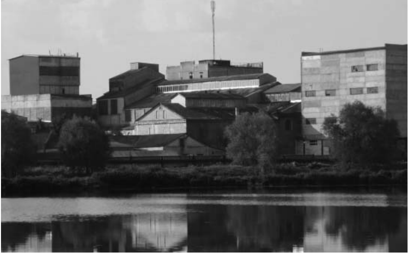
Рис. 2. Ансамбль цехових споруд цукрового заводу в смт Червоне Андрушівського р-ну Житомирської обл., липень 2014 р.

лює архітектурну привабливість та оригінальність промислового комплексу, як містобудівного утворення (рис. 2).