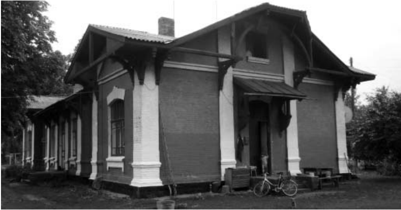
Рис. 5. Споруда вокзалу (1913 р.) залізничної станції «Дашівська» неподалік від проммайданчика цукрового заводу в селі Бабин Іллінецького р-ну Вінницької обл., липень 2013 р.

промислову. Ступінь охоронного режиму в них буде залежати від часу їх виникнення, художньої виразності і рясності архітектурно цінних споруд, меморіальної цінності, пейзажних якостей тощо. Але в будь-якому випадку, по нашому глибокому переконанню, містобудівні модулі, обумовлені цукровими заводами, не повинні залишатися поза увагою пам'яткоохоронців. Навіть, якщо перед нами тривіальна забудова. Навіть якщо відносно недавня. Адже пройде час і її історична цінність стане беззаперечною. А планування населеного пункту, обумовлене заводом, набуде ознак реліктового: завод зникне, а містобудівна структура, ним утворена, залишиться на довгі роки.