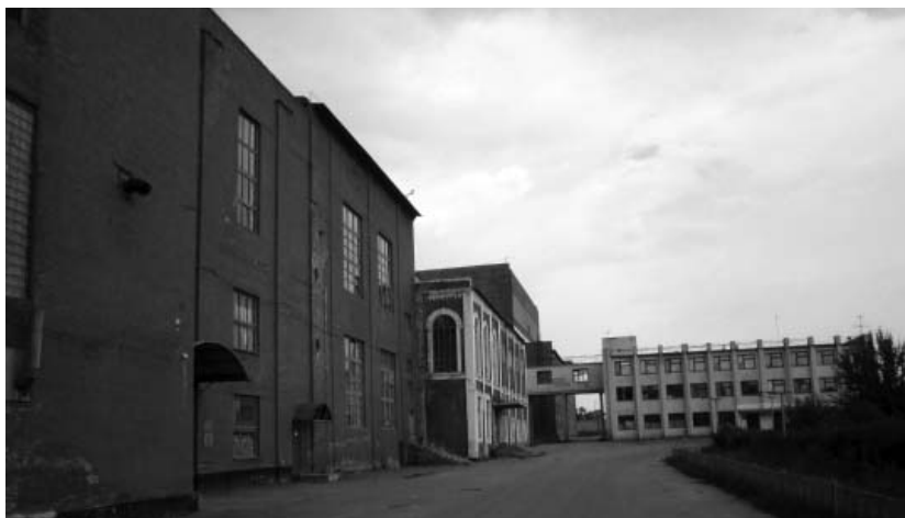
Рис. 3. Заводська вулиця – містобудівна складова забудови Шамраївського цукрового заводу в селі Руда Сквирського р-ну Київської обл., липень 2013 р.

Під час будівництва і функціонування гірничо-металургійних підприємств на Уралі в XVIII – на початку XIX ст. виникло поняття міста-заводу [15]. Це були