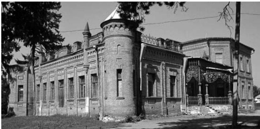
Рис. 4. Будинок в садибі колишнього господаря цукрозаводу в м. Бобровиця Бобровицького р-ну Чернігівської обл., серпень 2012 р.

Перелічені об'єкти слід об'єднати в цукрозаводські пам'ятоохоронно-містобудівні зони – селитебно-промислово і селитебну (з виокремленням соціально-інфраструктурної), садибну, залізничну, загально-промислово і агро-