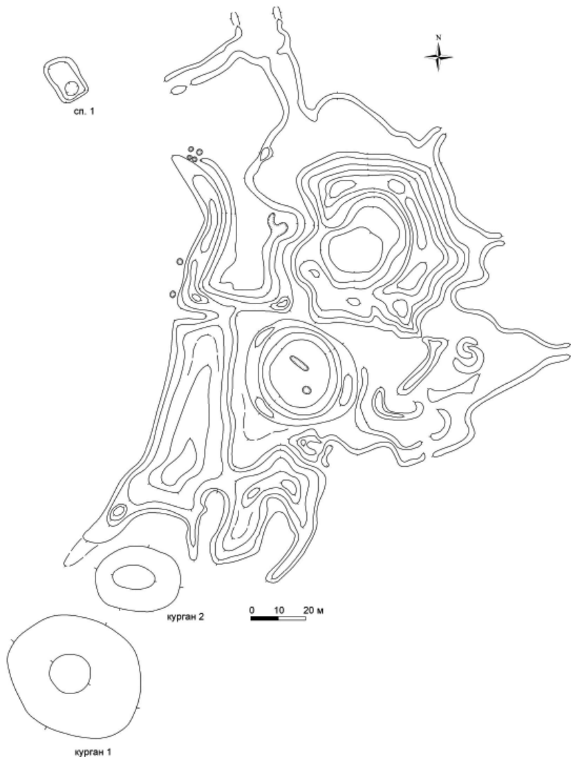
Рис. 2. Курганний могильник в с. Печише Сумського району. План Є.Осадчого і О. Короті 2012 р.

Співставлення виїмок і розривів рову Розритої Могили свідчить про те, що вони зроблені одночасно для того, щоб виносити ґрунт за межі майдану. Така конфігурація не є винятковою, майдани з двома та більше прохо-