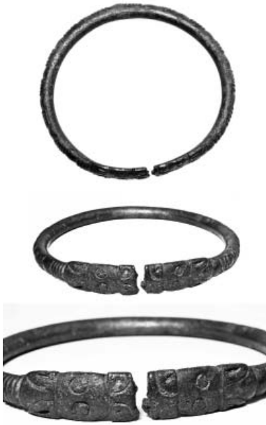
Рис. 4. Браслет з рубчиками на зовнішньому боці корпуса та зображеннями стилізованих «звіриних» голів на кінцях (с. Аксютинці).

поширені на той час у Скіфії, зокрема на землях Лісостепового Лівобережжя. Це припущення підтверджують зооморфні образи, подані на різних категоріях предметів. Яскравим прикладом є зображення тварин на кістяних псаліях, знайдених у курганах поблизу хут. Шумейко, сіл Волкові та Будки [11]. Деякі зразки передачі образу коня на зазначених предметах цілком відповідають створеному на бронзових браслетах. Характерні елементи – вушка, очі, видові ознаки – майстри застосовували в різних витворах, продовжуючи традиції звіриноного стилю (рис. 5).