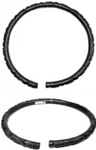
Рис. 2. Браслет з рівно обрізаними кінцями, прикрашений групами рубчиків, які чергуються з опуклими ділянками (с. Аксютинці)

У V ст. до н.е. почали виготовляти браслети, які привертають найбільшу увагу. Це вироби, прикрашені рубчиками на зовнішньому боці корпусу та зображеннями стилізованих «звіриних» голів на кінцях. Знахідки відмічено: в кургані № 4 поблизу с. Волковці (4 екз.); кургані А поблизу с. Басівка (2 екз.); кургані № 1 поблизу с. Аксютинці (1886 р.); 2 екз. із курганів Аксютинецької групи (розкопки В. Хвойки); цілий та уламок браслета із курганів Аксютинецької групи (НМІУ) [10].