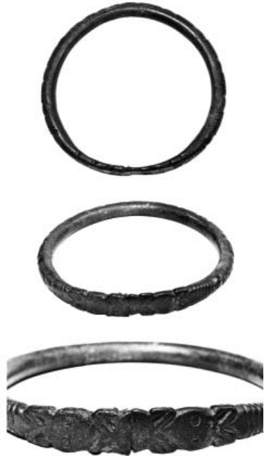
Рис. 3. Браслет, прикрашений рубчиками на зовнішньому боці корпуса та зображеннями стилізованих «звірних» голів на кінцях (с. Малі Будки).

Ще один варіант декору бачимо на виробі, що із походить із кургану поблизу с. Аксютинці (рис. 4). Розміри браслета: діаметри зовнішній – 131x119 мм, внутрішній 105x108 мм, стрижня – 13 мм. Стрижневий браслет з дещо розімкнутими кінцями (між ними проміжок 6–4 мм). На одному з них – наплив металу, на іншому – невеличка заглибина. Цей дефект утворився під час виготовлення виробу. Зовнішній бік прикрашено групами рубчиків, між якими – овальні опуклини. Розширені та сплюснені кінці оформлені стилізованими зображеннями голови тварини. Образотворчі деталі показано на трьох прямокутних ділянках на кінцях браслета. Середня площина розміщена дещо нижче від двох крайніх. На ній показано два кружальця – імітація очей. На прямокутнику справа двома дугоподібними лініями позначено ніздрі. На прямокутному відрізку зліва – гострокутні вушка, також виконані умов-