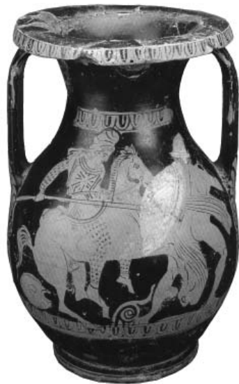
Рис. 1. Зображення амазонки, на щиколотках якої – браслети (пеліка з некрополя поблизу ст. Єлизаветівська, курган 2 за: L'Or des Amazones/Peuples nomades entre Asie et Europe VI siecle av. J.-C. – IV siecle apr. J.-C. / Musee Cernuschi. – Paris, 2001. – Kat. 114)

В.А. Іллінська наводила аналогії стрижневим браслетам, зробленим із гладенької заготовки, аналізуючи матеріали кобанської культури [6]. На наш погляд, подібність браслетів з цих двох регіонів приблизна. Адже вироби, наприклад із могильника 1 Меблева Фабрика,