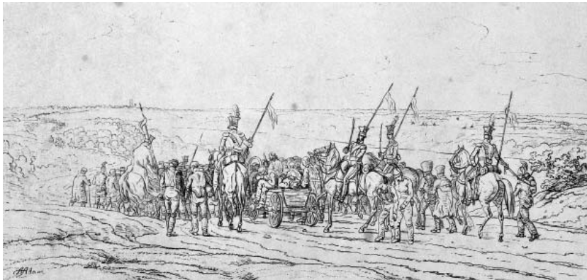
Рис. 6. Група російських військовополонених 23 липня. Літографія Альбрехта Адама. Видавництво Германа і Барта. Німеччина, Мюнхен, 1827–1833 роки.

Літографія пером «Група російських військовополонених 23 липня» (ГРЛ-3701/11) (Рис. 6) виконана за живописним оригіналом майже без змін. Ми бачимо як польські улани конвоюють російських полонених. Слід зауважити, що тема російських військовополонених війни 1812 р. вивчена не так повно – на відміну від теми полонених Великої армії Наполеона. Так само не знайдено багато їх зображень виконаних очевидцями [2, с. 187]. На літографії, на відміну від живописного оригіналу, ліворуч і праворуч додано декілька фігур польських уланів, які ведуть полонених росіян. Також відмінності полягають у розташуванні деяких фігур. З пояснювального тексту А. Адама – «Во время боя под Островно было захвачено много пушек, ящиков с боеприпасами и пленных, большинство из которых – драгуны и казаки императорской армии <...> На этом рисунке изображена колонна русских военнопленных, которых польские уланы ведут по дороге из Островно в Бешенковичи» [2, с. 191].