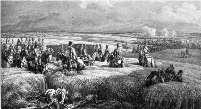
Рис. 5. Під Бешенковичами 25 липня. Літографія Альбрехта Адама. Видавництво Германа і Барта. Німеччина, Мюнхен, 1827–1833 роки.

Літографія «Під Бешенковичами 25 липня» (ГРЛ-4640) (Рис. 5) показує як полем пересувається кіннота, ліворуч – воєначальники верхи на конях спілкуються між собою. Живописний оригінал, із якого була зроблена літографія, з деякими відмінностями включено до каталогу виставки «Російський альбом Альбрехта Адама», що проходила в Державному Ермітажі в 1990 р. Перша відмінність – назва: «Прибуття італійського корпусу під Островно 25 липня 1812 р.».