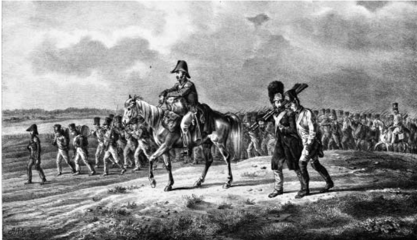
Рис. 3. Марш дивізії Піно, 16 липня 1812 р. Літографія Альбрехта Адама. Видавництво Германа і Барта. Німеччина, Мюнхен, 1827–1833 роки.

вів дивізіон, заплутався на шляху і таким чином довелося довго блукати в численних лісах без води і житла. Це також сприяло швидкій втомі. Виснажених і хворих людей доводилося залишати під деревами, але відновивши сили їм так і не вдалося приєднатися знову до своїх [4, с. 41–42]. Самі собою марші на початку революційних війн були тяжким тягарем для армії. Так, згідно з документами денний марш приблизно мав дорівнювати 30 км, або й більше 40 км. Піхота отримувала на марші житло та хлібний раціон. У прописаних умовах була й така: «Командующие должны наиболее заботиться о том, чтобы избегать марша войск по зерновым полям, виноградникам, около населенных пунктов, где бы они могли причинить ущерб, который придется возмещать владельцу, и что будет иметь последствия» [4, с. 42].