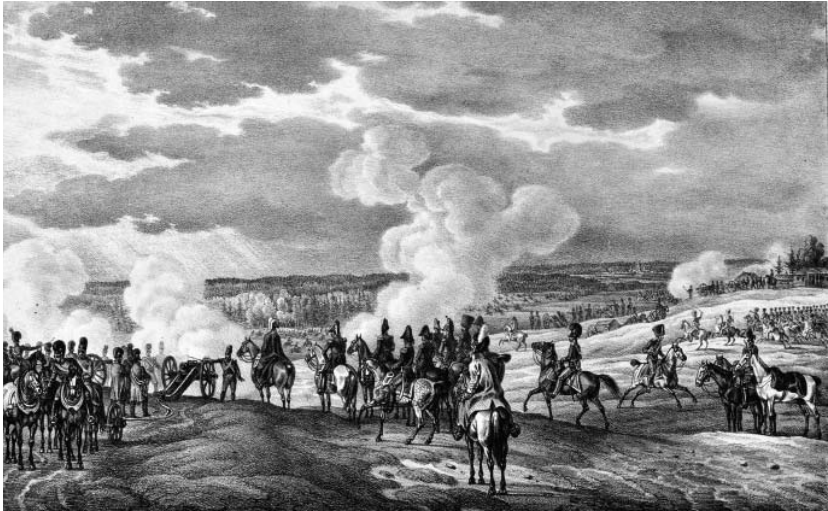
Рис. 7. Вранці 5 вересня перед Москвою. Літографія Альбрехта Адама. Видавництво Германа і Барта. Німеччина, Мюнхен, 1827–1833 роки.

Дві наступні літографії зображують події напередодні Бородинської битви 5 вересня 1812 р. На одному аркуші «Вранці 5 вересня перед Москвою» (ГРЛ-3701/27) (Рис. 7) в центрі зображений Євген Богарне, на другому – «Бородинська битва під Москвою ввечері 5 вересня» (ГРЛ-3701/71) – Наполеон. Як відомо, в цей день відбувалася битва за Шевардинський редут [8].