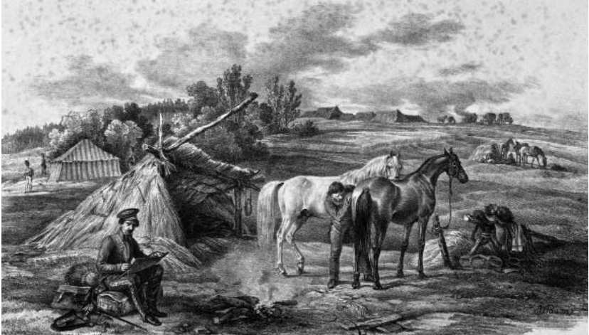
Рис. 4. Бівак художника 16 серпня. Літографія Альбрехта Адама. Видавництво Германа і Барта. Німеччина, Мюнхен, 1827–1833 роки.

Літографія «Під Бешенковичами 25 липня» (ГРЛ-4640) (Рис. 5) показує як полем пересувається кіннота, ліворуч – воєначальники верхи на конях спілкуються між собою. Живописний оригінал, із якого була зроблена літографія, з деякими відмінностями включено до каталогу виставки «Російський альбом Альбрехта Адама», що проходила в Державному Ермітажі в 1990 р. Перша відмінність – назва: «Прибуття італійського корпусу під Островно 25 липня 1812 р.».