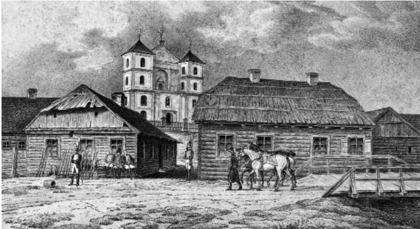
Рис. 2. В Нових Троках 4 липня 1812 р. Літографія Альбрехта Адама. Видавництво Германа і Барта. Німеччина, Мюнхен, 1827–1833 роки.

своїх спогадах офіцер італійської королівської гвардії Цезар Лож'є, учасник тих подій, враження від місцевості, де їм довелося зупинитися: «После четырех часов трудного перехода <...> мы прибыли в Новые Троки. Это местечко расположено на красивом холме, подножие которого омывается озером <...> На маленьком острове посреди озера высятся развалины старой крепости или замка, которые с одной стороны освещены солнцем, с другой – отражаются в озере, что представляет красивое зрелище. На вершине горы стоит великолепный монастырь, из которого можно вдаль различить город Вильну. В местечке три церкви, униатский монастырь, небольшой упраздненный форт и около 360 домов» [6, с. 18–19].