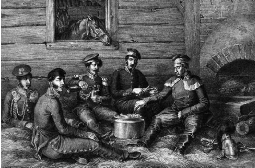
Рис. 1. Кальварія, 24 червня. Літографія Альбрехта Адама. Видавництво Германа і Барта. Німеччина, Мюнхен, 1827–1833 роки.

довгоочікуваним сном (ГРЛ-4858). Їх військові начальники в цей час, ймовірно, обговорюють план наступної битви (ГРЛ-3701/316). Наприклад, на аркуші під назвою «Кальварія, 24 червня» (ГРЛ-4642) (Рис. 1) зображені солдати французької армії, які сидять в сараї в містечку Кальварія (Велике Герцогство Варшавське) і «відзначають», так би мовити, початок війни. Тут солдатам корпусу Богарне офіційно оголосили наказ про війну з Росією. В живописному ж варіанті – «Головна квартира в Кальварії 24 червня 1812 р.» – сюжет мав зовсім інший вигляд: «В центрі, перед будинком, що зайнятий головною квартирою, – віце-король (спиною до глядача), який розмовляє з двома генералами, правіше – офіцери свити. Ліворуч – обозні вози. На караулі – гренадери королівської гвардії» [6, с. 16]. Як бачимо, в літографованому варіанті сюжет значно спрощений автором.