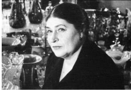
Іл. 1. Народний художник України Л.М. Митяєва

У 1951 р. художниця перейшла працювати на Київський скло-термосний завод і, власне, започаткувала там творчий колектив. У ці роки Л.М. Митяєва почала працювати майстром з техніки глибокого травлення «галле». В матеріалах художньої ради заводу за 1951 р. уперше знаходимо її ім'я як майстра живопису у цій техніці [1, с. 6].