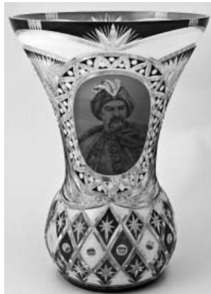
Лл. 5. Л.М. Митяєва. Декоративна ваза «Б. Хмельницький». КЗХС. 1954 р.