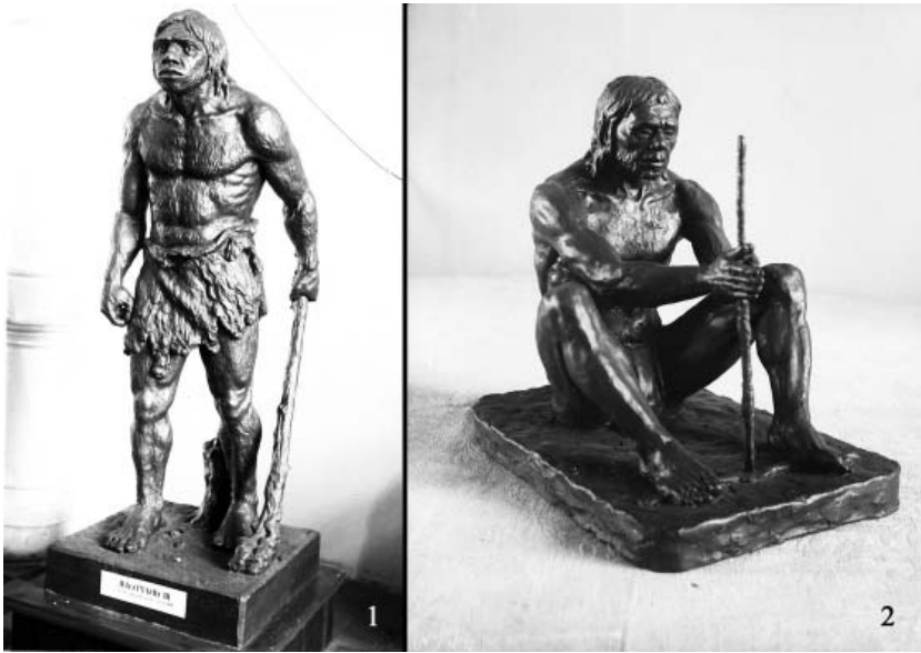
Рис. 4. Скульптури І. Гончара з експозиції відділу докласового суспільства ЦІМ (1938–1941 рр.): 1 – неандерталець; 2 – видобування вогню кроманьйонцем.