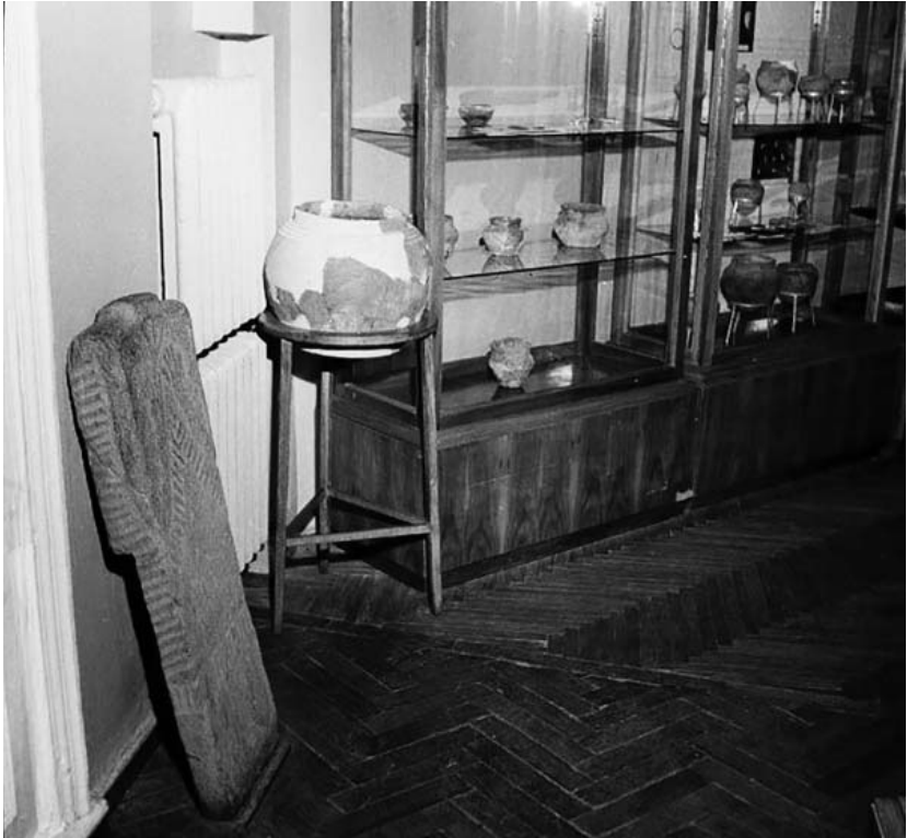
Рис. 7. Фрагмент експозиції доби бронзи (фото 1960-х – 1970-х рр.).

на Уманщині (рис. 7) експонується у коридорчику між сучасними 3 і 4 залами, які зараз присвячені скіфському і античному періодам. Зміна розташування залів відбулася після капітального ремонту музею 1973–1977 рр. У плані роботи відділу Первісного суспільства на 1973 р. одним з першочергових завдань стоїть: «Перефотографувати діючу експозицію, демонтувати існуючу експозицію та перенести у фонди» [10, арк. 1]. Тому згадані фотоплівки мають датуватись не пізніше 1973 р.