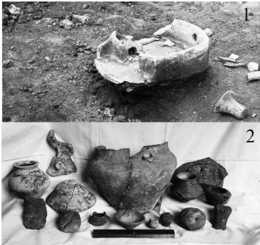
Рис. 2. Негативи з підписами В.Є. Козловської матеріалів розкопок поселення поблизу с. Сушківка на Уманщині 1916 р.: 1 – трипільська модель житла у розкопі; 2 – керамічні вироби.

с. Сушківка на Черкащині 1916 р. Так, наявна фотографія відомої трипільської моделі житла під час розкопок (рис. 2, 1). Негатив має напис рукою В.Є. Козловської, де вказано місце знахідки: с. Сушківка Уманського повіту Київської губернії. Кілька фотографій були використані у публікації про результати розкопок у 1926 р. [15, рис. 1–4, 6, 7]. Частина негативів до цієї публікації також має написи почерком В.Є. Козловської (рис. 2, 2).