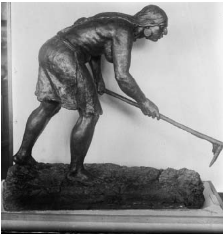
Рис. 5. Скульптура І. Гончара «Мотичне землеробство» (фото 1940-х – 1950-х рр.).

Зустрічається на фотографіях експозиції, зокрема, на знімках, наведених Р. Штамфусом