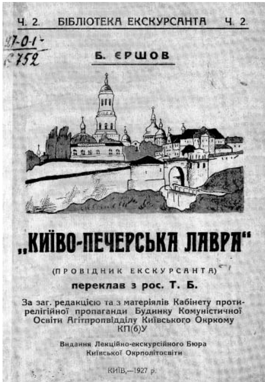
Рис. 2. Титульний аркуш видання Б. Єршова «Києво-Печерська лавра»

Водночас провідник Б. Єршова, зокрема характеристика Успенського собору, засвідчує зміну акцентів у екскурсійній роботі, яка вже в першому десяти-