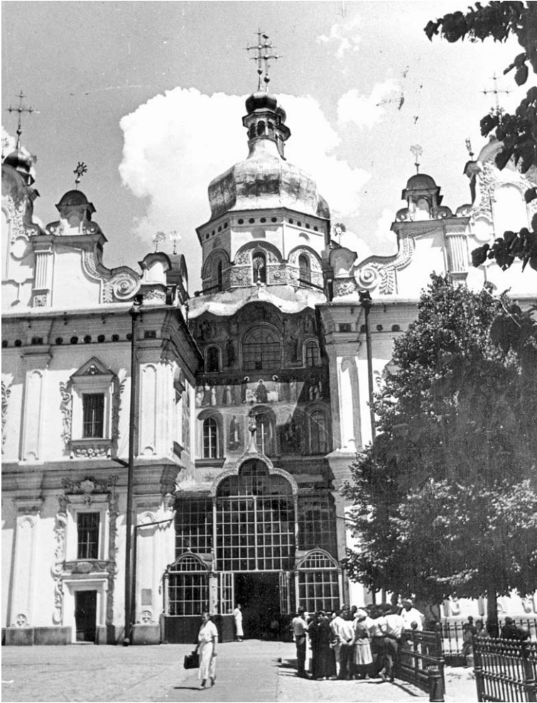
Рис. 1. Група екскурсантів біля Успенського собору Києво-Печерської лаври. 1920–30-ті рр.

Водночас, ухвалення рішення «Про закриття Києво-Печерської лаври і виселення її ченців» від 18 листопада 1929 р. створювало умови для остаточного перетворення Успенського собору на засіб ідеологічної антирелігійної пропаганди (рис. 1).