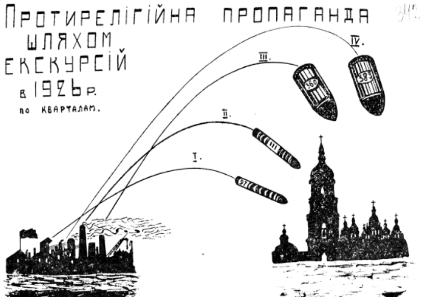
Рис. 5. Звітна ілюстрація Київського Лекційно-екскурсійного бюро Окрполітосвіти УСРР «Протирелігійна пропаганда шляхом екскурсій 1926 р.» [ЩДАВО України, ф. 166, оп. 6, спр. 563, арк. 342]

акцентів у екскурсійному показі культових пам'яток, і Успенського собору зокрема, корелюється із поступовим витісненням (головним чином, репресивними заходами влади) із гуманітарного співтовариства української інтелігенції та її заміною на «бійців партії», «пропагандистів-бійців» ідеологічного фронту, марксистів, «войовничих безвірників». Протягом другої половини 1920-х рр. у Великій Печерській церкві відбувалися релігійні відправи й водночас храм використовувався як об'єкт екскурсійного показу – пам'ятка української архітектури, мистецтва та історії. Антирелігійна політика радянського уряду, спрямована на дискредитацію та знищення лаврської чернечої громади сприяла остаточному перетворенню Успенського собору на засіб ідеологічної пропаганди. Протягом другої половини 1920-х – 1930-х рр. поступово збільшувалася кількість годин для екскурсійного огляду ВМГ та, зокрема, Успенського собору, як його складової частини. Звертає на себе увагу той факт, що собор залишився одним із видатних екскурсійних об'єктів: інформація про Музей історії Лаври, порівняльної історії культів, та зал для «перемінних виставок», що були розміщені в Успенському соборі, фактично не представлена у краєзнавчодовідковій літературі другої половини 1920-х – 1930-х рр. на противагу докладним характеристикам Великої печерської церкви та її пам'яток.