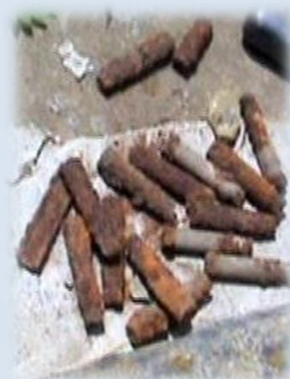
Фото 4-6. Підводні знахідки: кремень та залізо.