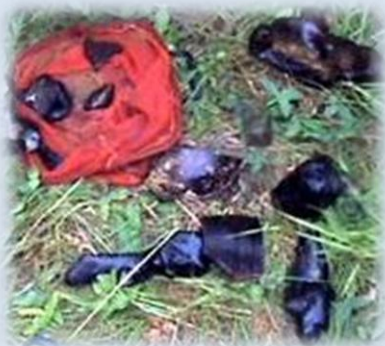
Фото 10-14. Підводні знахідки біля Кривої Луки