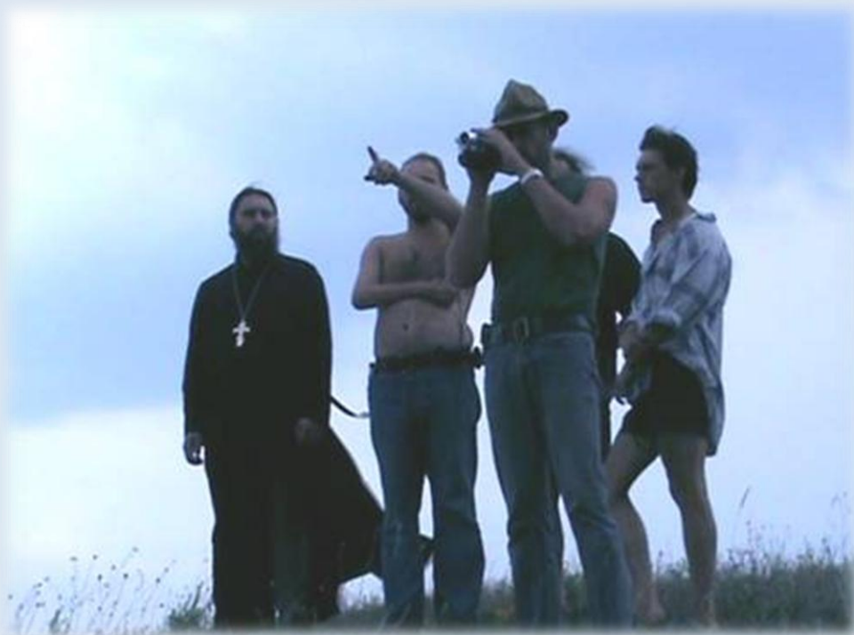
Фото 8. Огляд місця бою біля Кривої Луки

Першими на місце прибули царські війська, які встановили артилерійські батареї, очікуючи просування козаків саме цим шляхом. Інакше кажучи, бригадир Шидловський організував засідку, використовуючи рельєф місцевості та побудувавши редути. Повстанці проривалися на Дон - до К. Булавина. Йшли кінним порядком та по річці на стругах.