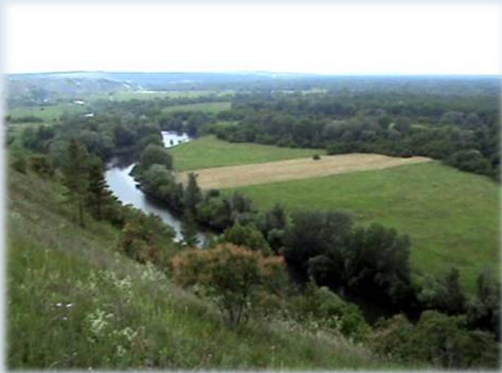
Фото 7. Сіверський Донець біля Кривої Луки.

І ось десь тут, на цих пагорбах, триста років тому розгорталися драматичні події. Звернемося ще раз до звіту архіваріуса Івана Михайлова: „А июля в 1 и во 2 числах они ж, воры, воровским своим собранием приходили под Тор и под Мояки я, поставя обоз свой под Тором, чинили воровской свой промысл и Торской посад выжгли. И он, лейб-гвардии маэор, видя такую их воровскую противность и непокорение, посылал бригадира Шидловского да полковников Мещерского, Кропотова, Гульца с драгунами и салдацкими полками, чтоб до разорения тех городов их, воров, не допустить. И они, воры Дранной с товарищи, непохотя ему, великому государю, быть в покорении, засели в осаде в урочище Кривой Луки у реки Донца и стали чинить с ево государевыми ратными людьми бой. И на том бою он, вор Дранной, и иные многие побиты и в Донце потопли, а потом и Бахмут выжгли до основания и взяли бахмуцкого атамана с товары[щи]” [7].