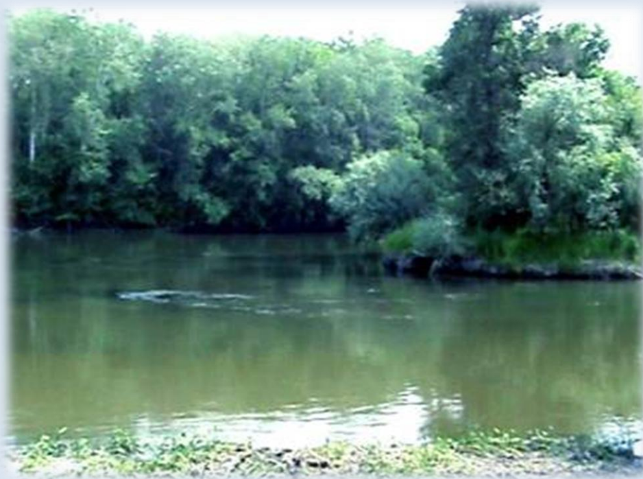
Фото 3. Безим'яний острів на Сіверському Донці, біля якого шукали козацькі човни

По-третє, з чим ми зіткнулися у Сіверському Донці, – це сильна течія. Коли ми переконалися з марністю пошуків козацьких човнів, то вирішили просто оглянути дно, тим більше, що у деяких вирах глибина доходила до трьох метрів.