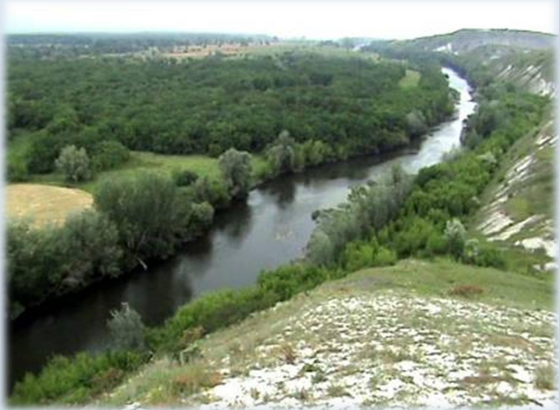
Фото 9. Сіверський Донець біля Кривої Луки

Священик Олександр повідомив також про знайдені місця захоронення загиблих у тому бою козаків, але це цікавило нас менше, ніж дно Сіверського Донця.