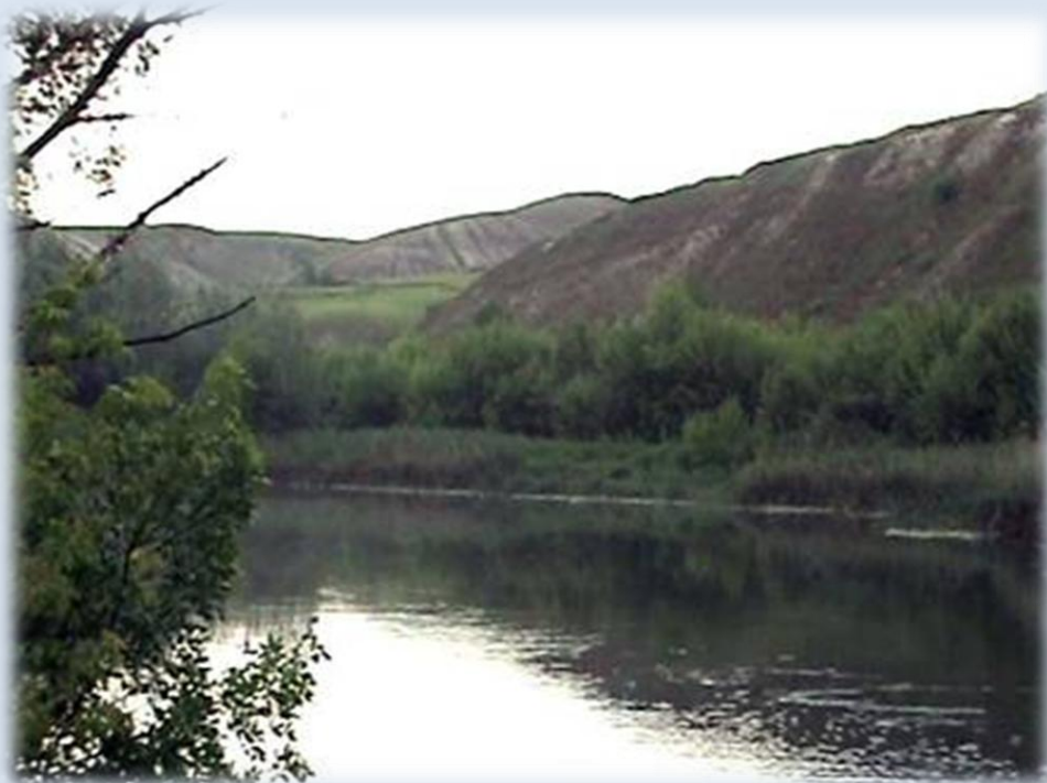
Фото 15. Крива Лука

Похід Семена Драного на Сіверський Донець взагалі був чи не найрішучою та послідовною дією повстанців. Схоже, що С. Драний очолював радикальні кола козацької голоти. Донський козак із Старо-Айдарського містечка, він був обраний отаманом. Вже після придушення повстанців, під час слідства та допита полонених козаків чимало з них посилалися на Драного як на ініціатора – „луцого заводчика” повстання, який підбурював до бунту самого К. Булавіна.