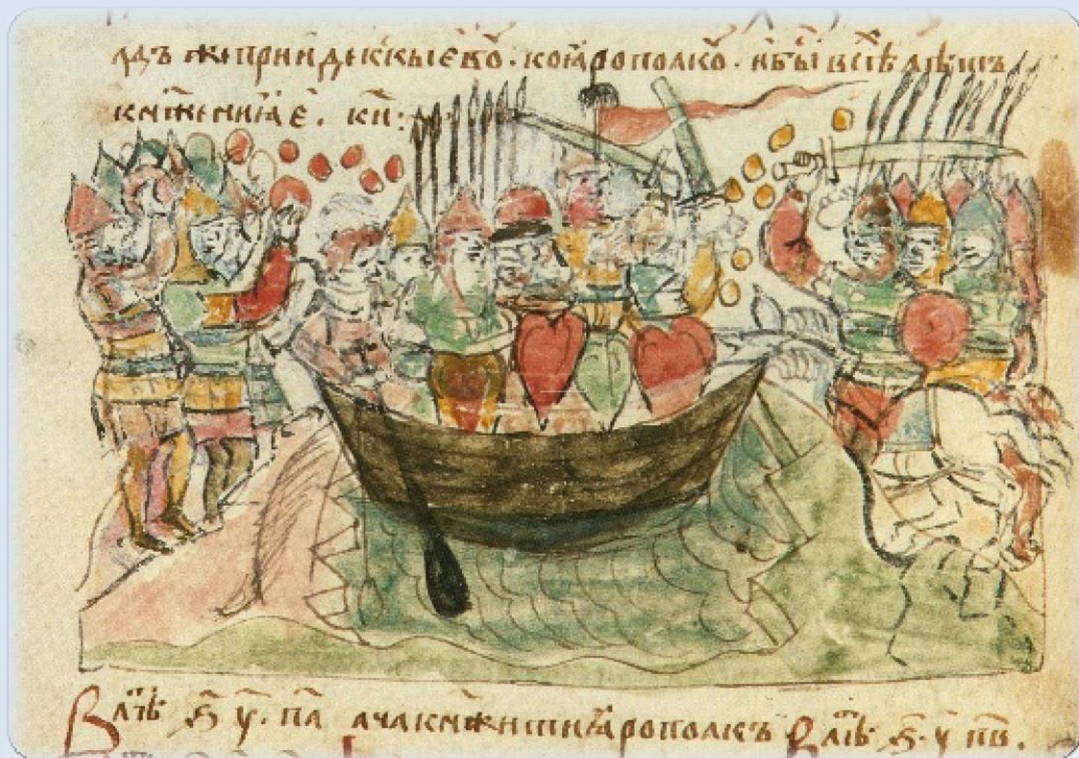
Мал. 1. Мініатюра Радзивилівського літопису.

По-друге, мініатюра Радзивилівського літопису, яка присвячена останньому бою кн. Святослава (Мал.1) при дослідженні цієї події в джерелознавчому контексті дослідниками практично не розглядалася. Чи не єдиним виключенням є лаконічне зауваження Б.Рибаківа про те, що зображення містить «цікаву деталь» – «кочівники закидають руський флот камінням з обох берегів» [12, с.285].