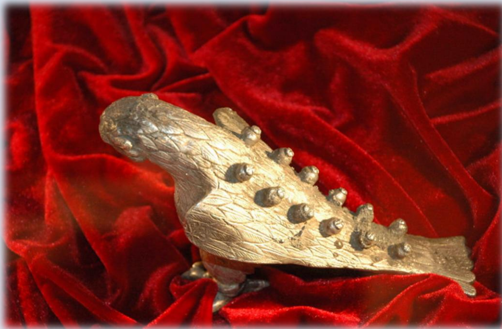
Фото 2. Орел з «Кічкаського скарбу».

Цей список можна поповнити даними про залишки суден та інші артефакти ймовірно Х ст., винайдені під час днопоглиблювальних робіт у східному від