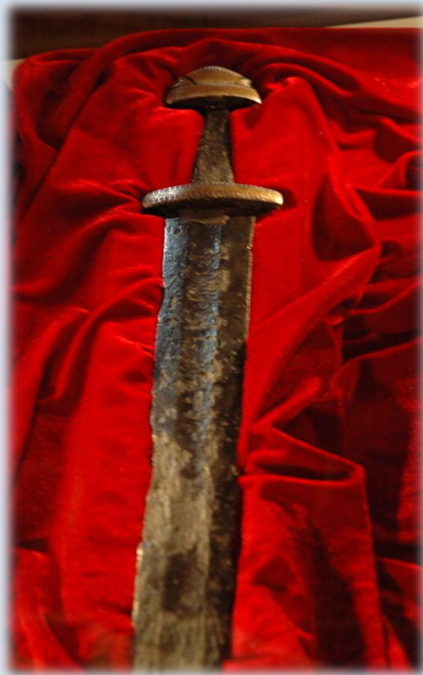
Фото 1. Меч, знайдений у о. Хортиці в 2011 році.

Нова знахідка доводить, що, по-перше, дніпробудівські артефакти є не випадковими і мають розглядатися разом із іншими пам'ятками того ж часу як свідчення конкретних історичних подій; по-друге, що потенціал археологічних досліджень в районі Хортиці не вичерпано, хоча вони й тривають на території потужного урбанізаційного впливу, через що вже наполовину стали охоронно-рятувальними [4, с.209].