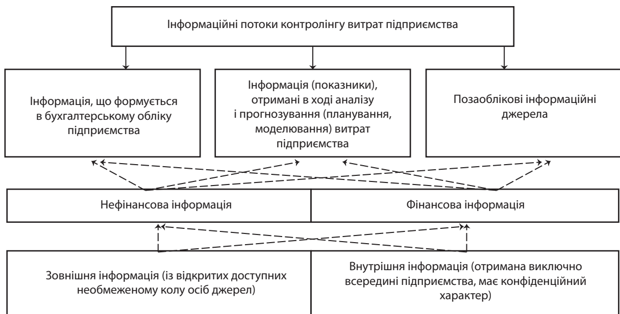
Рис. 2. Інформаційні потоки контролінгу витрат підприємства*