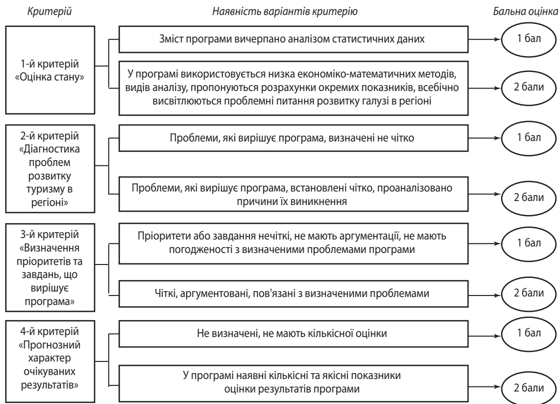
Рис. 2. Структура оцінки державних програм розвитку туристичної галузі за науковою обґрунтованістю

Зі змісту рис. 2 випливає, що першим критерієм оцінки програм розвитку туристичної галузі за науковою обґрунтованістю є критерій «оцінка стану». Перший варіант цього критерію передбачає аналіз основних статистичних показників та їх динаміку у порівнянні із аналогічними показниками інших областей України, де також існують програми розвитку туристичної галузі. Такий аналіз не є глибоким та не висвітлює специфіки його розвитку і проблему, тому такий програмі буде присвоєно 1 бал. І, навпаки, програма, яка за даним критерієм містить ґрунтовний аналіз результатів дії попередніх програм, у розрахунках використовуються економіко-математичні методи та запропоновані різноманітні види аналізу, зроблено акцент на