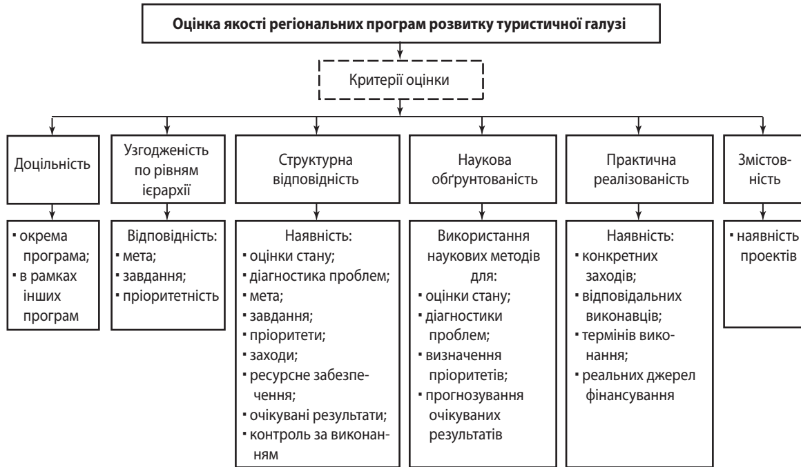
Рис. 1. Модель оцінки якості програм розвитку туристичної галузі в регіонах України

Виходячи з наведеного вище аналізу, було розроблено модель оцінки якості програм розвитку туристичної галузі в регіонах України , що дозволяє нівелювати вказані недоліки (рис. 1).