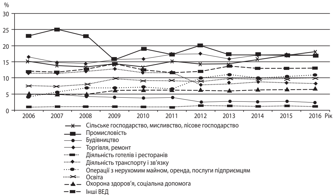
Рис. 2. Динаміка структури ВДВ Закарпатської області (за секторами економіки) та прогноз на 2014 – 2016 роки, %

* Розраховано та побудовано на основі даних Головного управління статистики у Закарпатській області