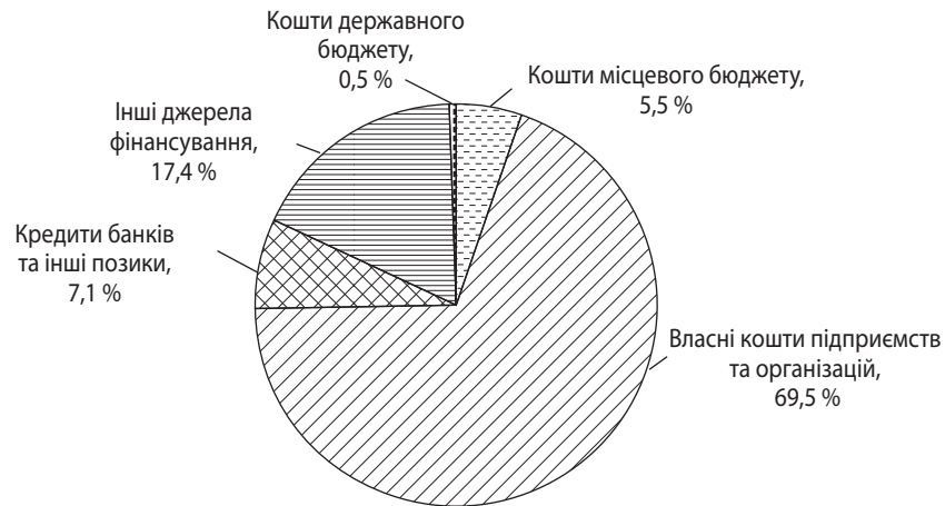
Рис. 3. Структура джерел фінансування капітальних інвестицій підприємств Сумської області у 2014 р.