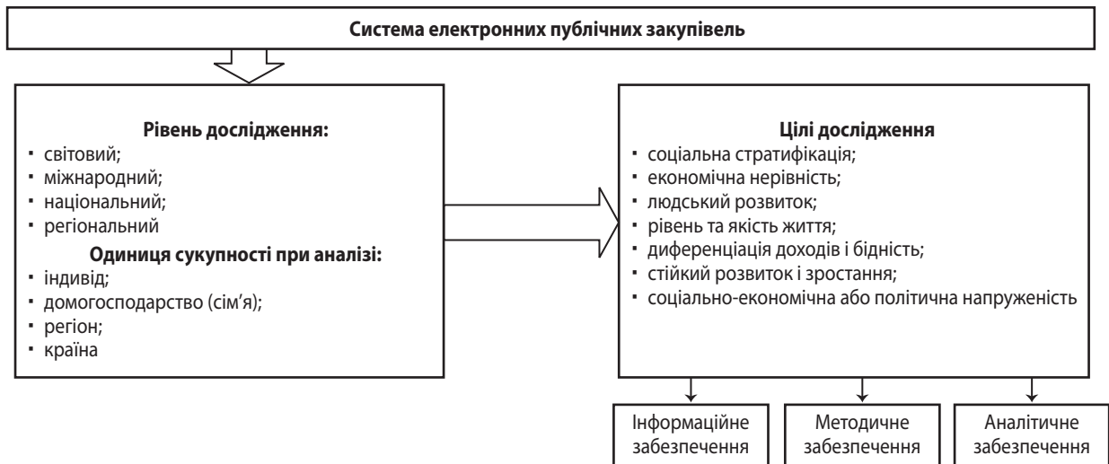
Рис. 1. Блоки статистичного забезпечення аналізу соціальної стратифікації та економічної нерівності населення