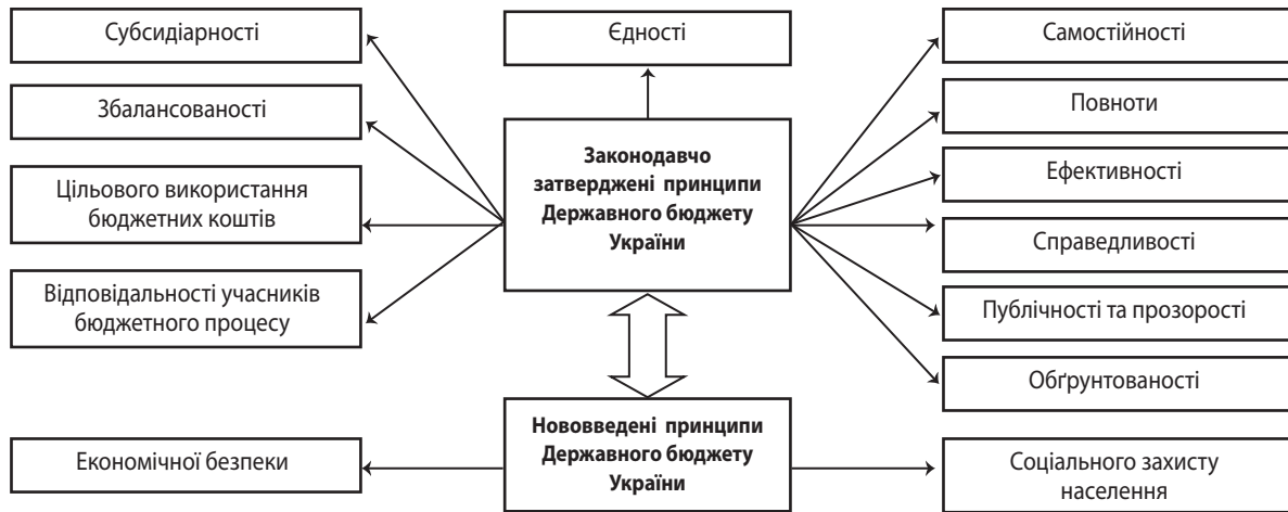
Рис. 2. Удосконалена схема принципів Державного бюджету України