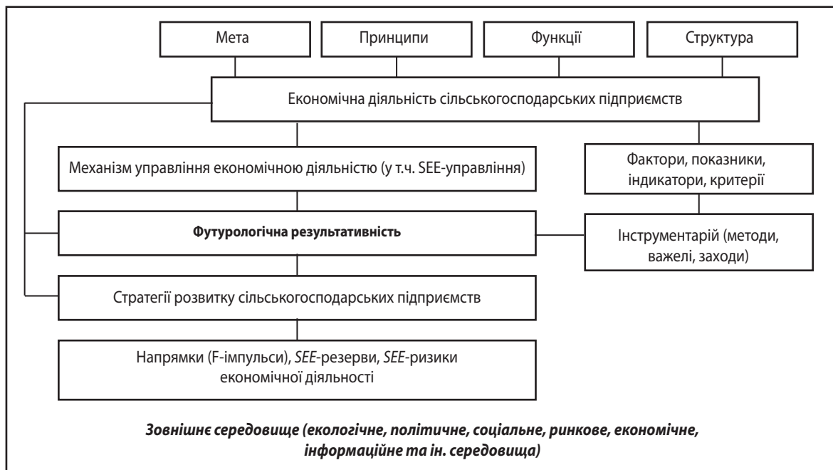
Рис. 2. Механізм економічної діяльності сільськогосподарських підприємств

спрозрахунок, фінансування, умови реалізації продукції, виробничо-технічне обслуговування, умови господарювання, різні ліміти, собівартість продукції, рентабельність