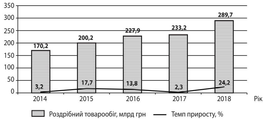
Рис. 2. Динаміка та темп приросту роздрібного товарообігу продуктів харчування в Україні