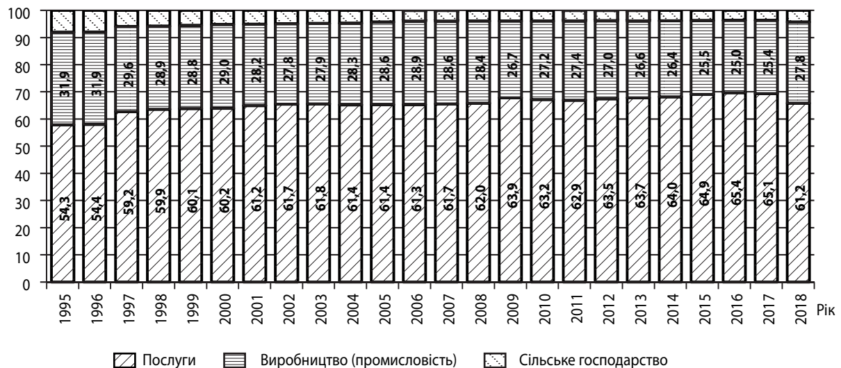
Рис. 1. Частка секторів економіки у світовому ВВП, %