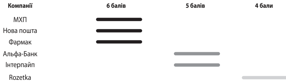
Рис. 3. Результати дослідження та умовна оцінка репутаційної складової корпоративної соціальної відповідальності українських компаній – лідерів з КСВ у 2020 році