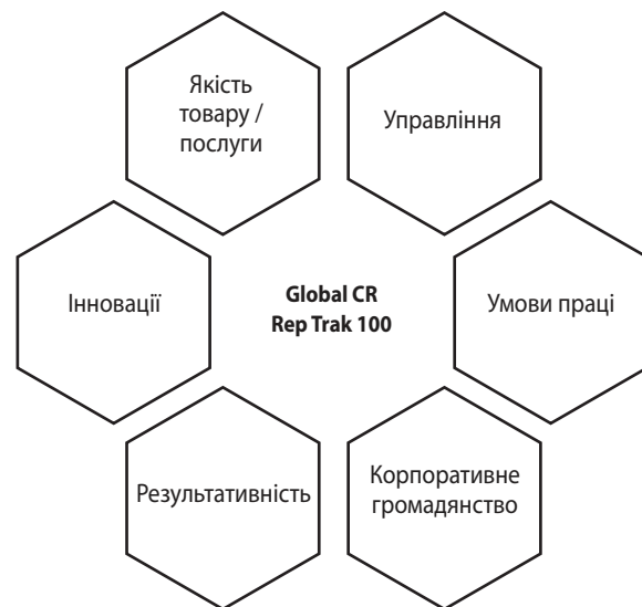
Рис. 1. Основні драйвери Global CR RepTrak 100

Оцінку глобальних компаній на основі репутації їхньої корпоративної соціальної відповідальності щороку наведено в рейтингу Global CR RepTrak 100 [2], який проводить Інститут репутації – організація, що спеціалізується на вивченні репутації бренду і корпоративного іміджу. Станом на початок 2021 року дані для побудови цього рейтингу були зібрані з позиції понад 68 тис. респондентів серед широкої громадськості у п'ятнадцяти найбільших світових економіках і розраховані на основі сімох складових корпоративної соціальної відповідальності (рис. 1).