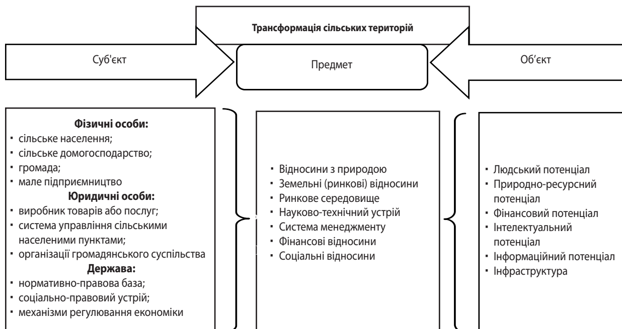
Рис. 1. Суб'єкт, предмет, об'єкт процесу трансформації сільських територій

Виклад основного матеріалу дослідження. Вивчення процесу трансформації сільських територій в цілому як соціально-економічного явища передбачає виділення суб'єктів, об'єктів і предметів цього процесу (рис. 1). З точки зору філософії суб'єкт (лат. subjectum – те, що лежить внизу, перебуває в основі) – поняття, яке означає носій діяльності, що пізнає світ навколо себе та впливає на нього; людина або група осіб, культура, суспільство або людство в цілому, на відміну від того, що вивчається або змінюється внаслідок дій [26]. Невід'ємною характеристикою суб'єкта соціально-економічної системи є здатність самостійно приймати рішення і самостійно здійснювати соціальну та господарську активність. Під час цієї активності вони ставлять конкретні цілі, приймають самостійно основні соціальні та господарські рішення, є соціально адаптованими, беруть участь у виробництві, розподілі, обміні та споживанні економічних благ.