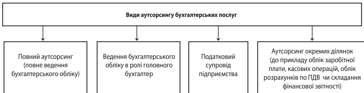
Рис. 3. Види аутсорсингу бухгалтерських послуг