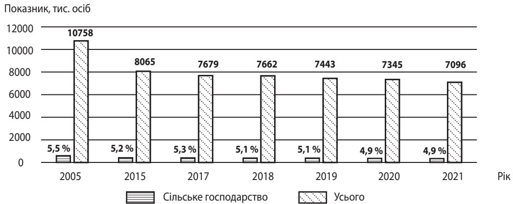
Рис. 3. Динаміка середньооблікової кількості штатних працівників у сільському господарстві та сукупного показника за іншими видами економічної діяльності, тис. осіб