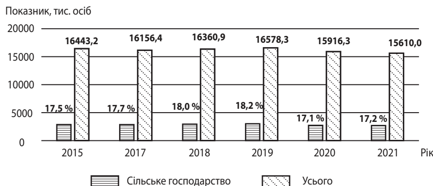
Рис. 2. Порівняння динаміки зайнятості населення у сільському господарстві та сукупного показника за іншими видами економічної діяльності, тис. осіб

На сьогодні продуктивність праці вимірюється в доларах США на людину-годину і обчислюється шляхом ділення загального ВВП країни на загальний робочий час усіх працевлаштованих за рік. Цей найважливіший показник в Україні знаходиться зараз на дуже низькому рівні: $5 на люд.-год., в той час як країни – світові лідери мають цей показник на рівні від $68 до $103, і навіть якщо порівняти, наприклад, із сусідніми країнами, то цей показник все рівно в 5–8 разів менше: Словаччина – $44, Угорщина $38, Болгарія – $26. Навіть у найприбутковішій галузі в нашій країні – ІТ-галузі – продуктивність становила $22 на