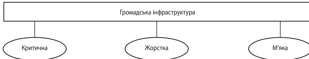
Рис. 1. Види громадської інфраструктури

З економічної точки зору громадську інфраструктуру поділяють на такі види (рис. 1).