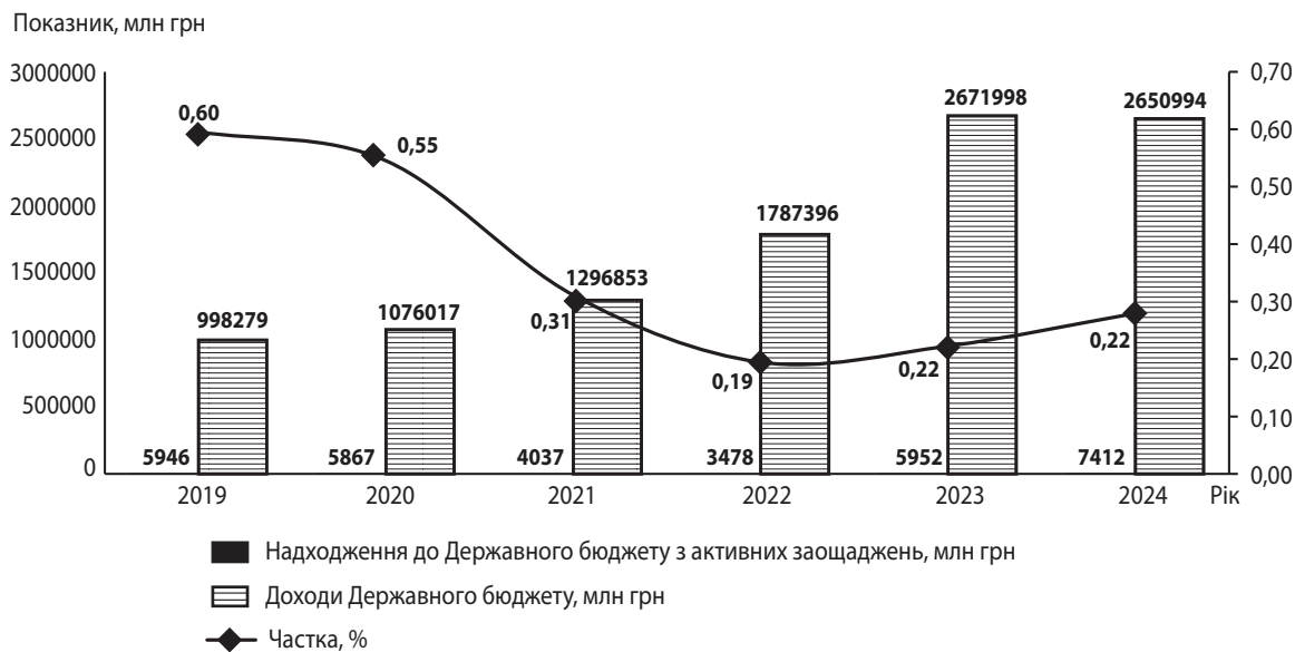
Рис. 4. Частка надходжень від активних заощаджень в доходах Державного бюджету в Україні за 2019–2024 рр.

впала до 0,31 %, що було спричинено різким зниженням заощаджень та зростанням доходів бюджету за рахунок зовнішніх запозичень та інших джерел. У 2022 році частка скоротилася до 0,19 %, що відображає кризову ситуацію в економіці та необхідність уряду покладатися на зовнішню допомогу. У 2023 році частка зросла до 0,22 %, що свідчить про часткове відновлення заощаджень та стабілізацію бюджетних доходів. У 2024 році частка збільшилася до 0,28 %, відображаючи поступове повернення домогосподарств до накопичення коштів. Загалом частка надходжень з активних заощаджень в доходах Державного бюджету також