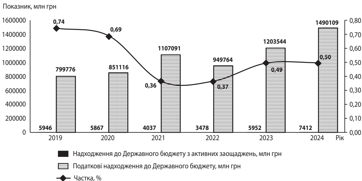
Рис. 3. Частка надходжень до Державного бюджету з активних заощаджень у податкових надходженнях Державного бюджету України за 2019–2024 рр.