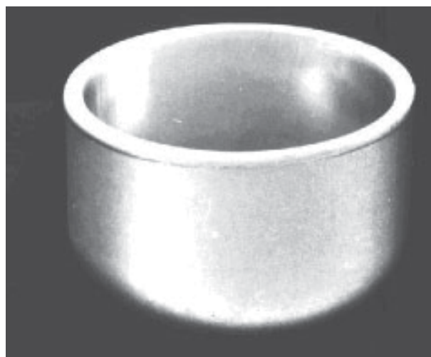
Рис. 1. Молибденовый тигель с защитным покрытием для варки стекла в оптическом стекловарении.

Электроды с защитными покрытиями в процессе эксплуатации не дают окраски навариваемых стекол.