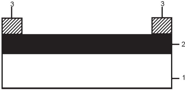
Рис. 1. Схема сцинтилляционного фотодетектора излучения на основе CdTe-ZnSe: 1 – ZnSe, 2 – CdTe:Ag, 3 – контакты.

или рентгеновскими лучами, вызывающими люминесценцию ZnSe. Ультрафиолетовый свет или рентгеновский луч, проходя через сцинтиллятор 1, переводит электроны из валентной зоны в зону проводимости или с глубоких уровней в зону проводимости.