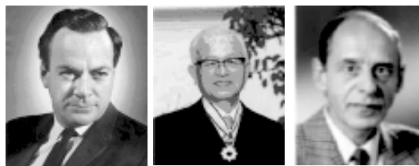
Рис. 1. Фотографии Р. Фейнмана (1918-1988), Н. Танигучи (1912-1999) и Г. Глейтера.

Дальнейший рост интереса к нанотехнологиям и развитие терминологии этого направления возникли после открытия уже в 80-х