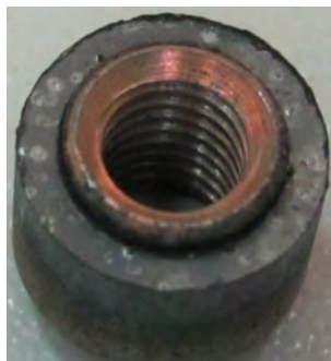
Рис. 2. Общий вид перлины после прессования

Общий вид перлины после прессования показан на рис. 2.