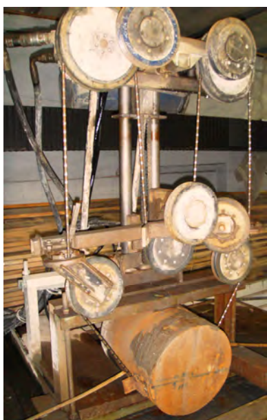
Рис. 1. Общий вид канатной пилы

Ключевые слова: связка, абразивные частицы, канатная пила.