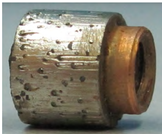
Рис. 9. Общий вид перлины после работы в канатной пиле

Общий вид перлины после работы в качестве элемента режущего инструмента показана на рис. 9.