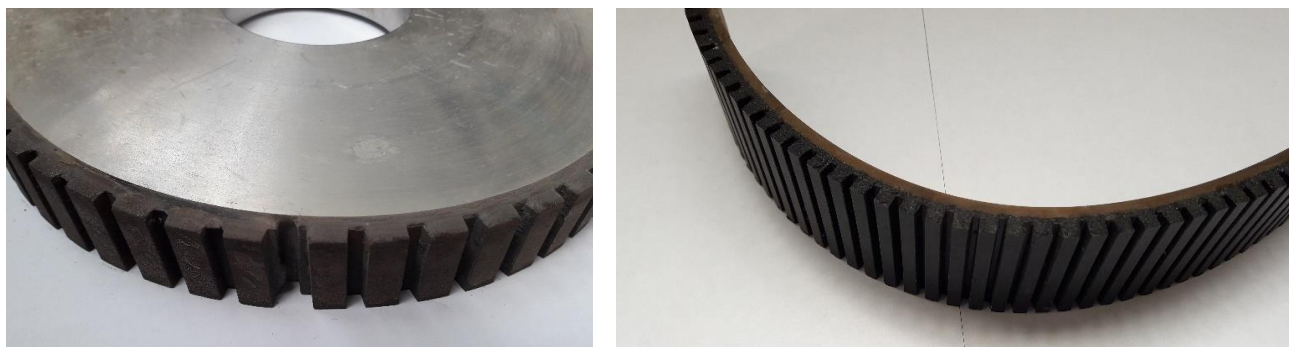
Рис. 3. Стрічка типу АСШЛ на різних етапах виготовлення шліфувального круга діаметром 300 мм