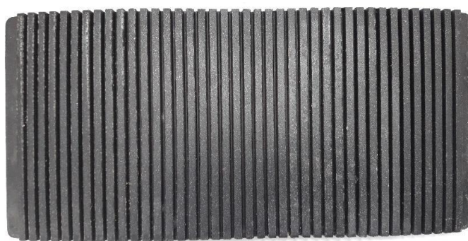
Рис. 2. Зовнішній вигляд переривчастої стрічки типу АСШЛ