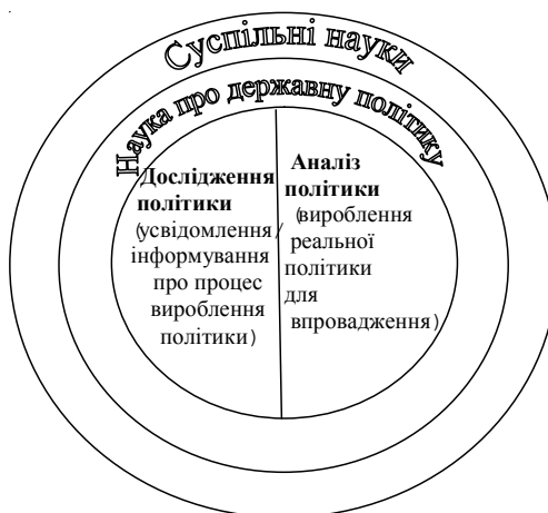
Дисциплінарні рамки науки про [державну] політику

Останнім часом українські політологи звернули увагу на аналіз політики як на важливу субдисципліну, що використовує значну кількість методів дослідження, підходів, характеристик тощо інших споріднених наук, а також завдяки таким важливим суспільним стимулам, як: