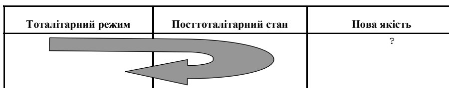
Модель зворотного розвитку