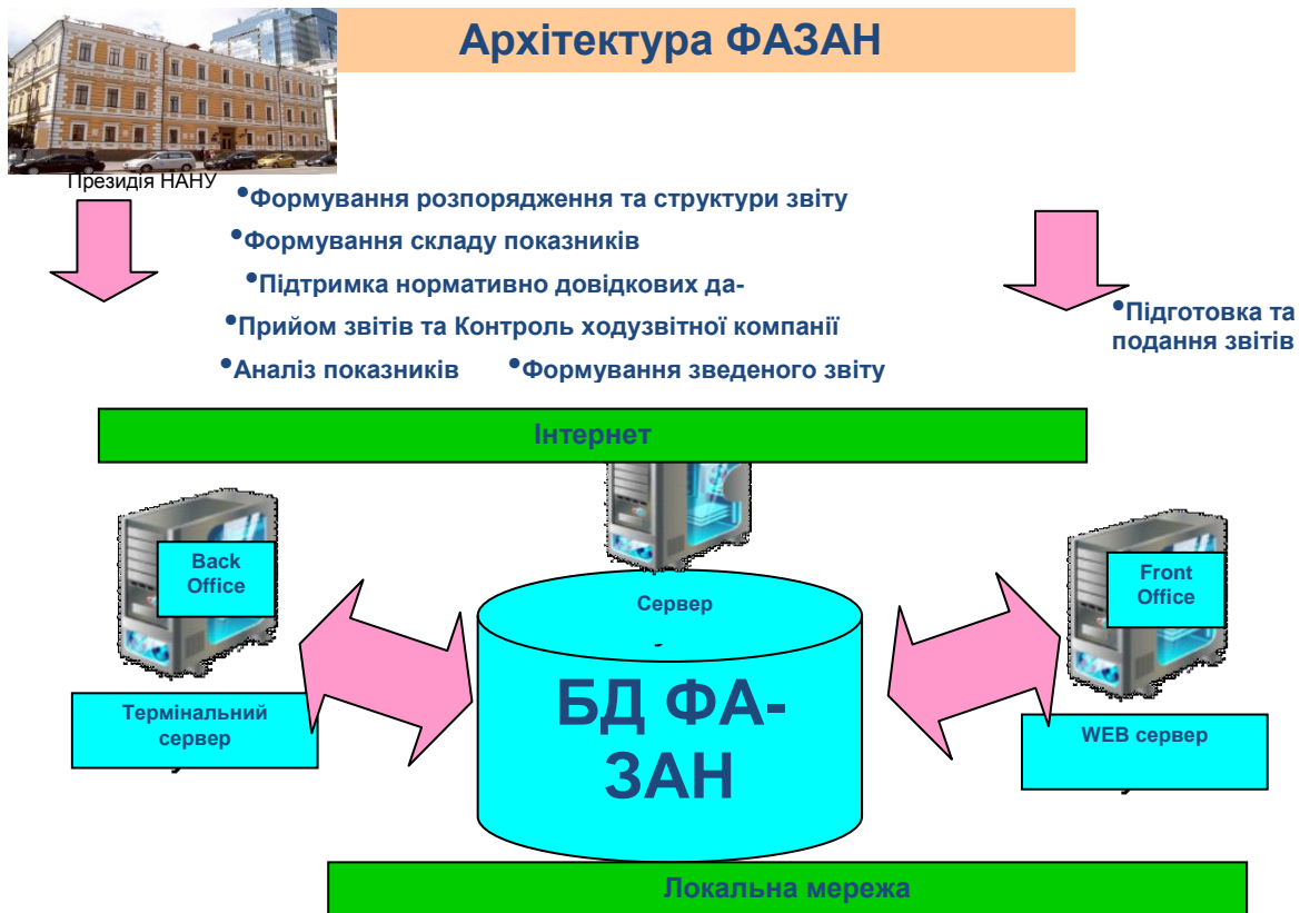
Рис. 2. Загальна архітектура системи ФАЗАН

Для виконання операцій застосовуються програмні компоненти, які забезпечують користувачам: