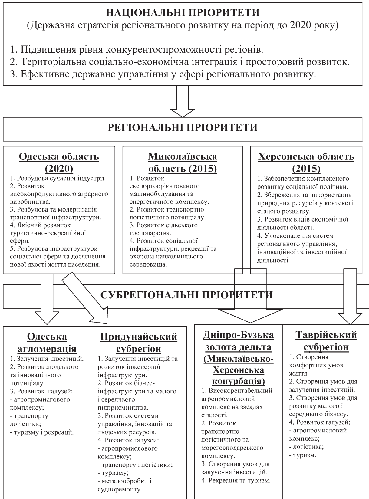
Рис. 2. Пріоритети регіонального розвитку в приморських регіонах та субрегіонах Українського Причорномор'я

там новітньої регіональної політики саморозвитку (табл. 1).