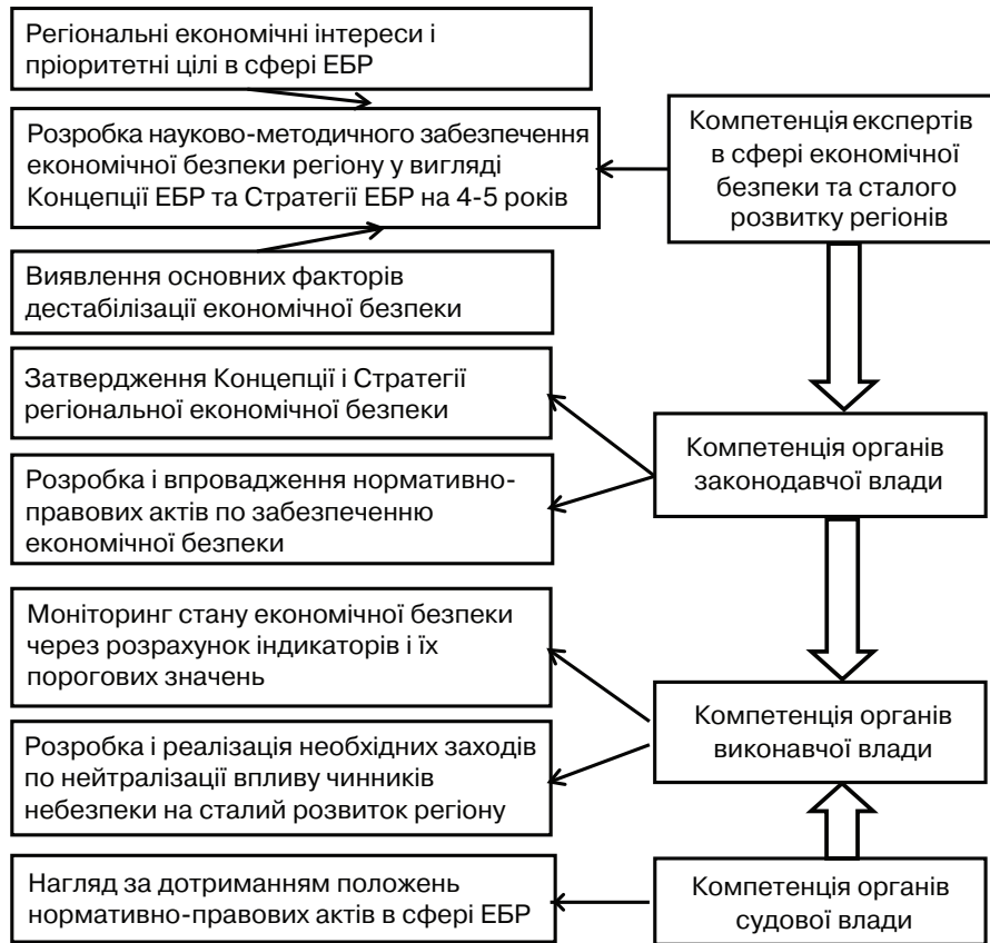
Рис. 2. Розподіл компетенцій між органами регіональної влади для забезпечення ЕБР*