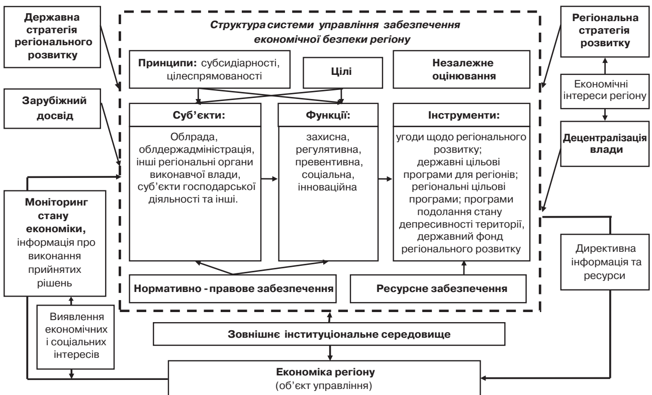
Рис. 1. Структура комплексного механізму забезпечення економічної безпеки регіону*