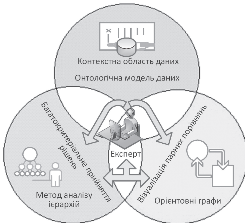
Рис. 2. Структура інтеграційного експертного методу прийняття рішень

Інтеграційний експертний метод і розроблений відповідний програмний інструментарій можуть бути застосовані безпосередньо під час виконання процедур оцінювання ефективності діяльності конкретних НУ. У ролі альтернатив роз-