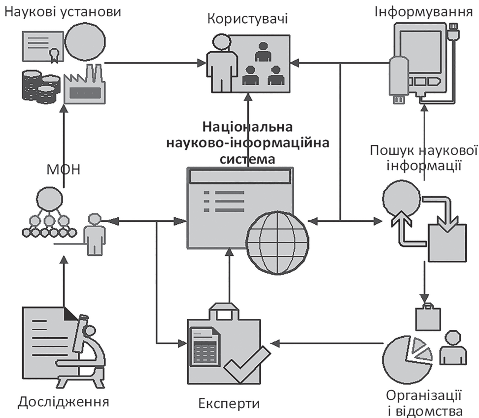
Рис. 1. Національна електронна науково-інформаційна система

Серед функцій системи необхідно виділити забезпечення взаємодії між суб'єктами діяльності, систематизацію та узагальнення інформації, перетворення її до формату даних, придатного для проведення подальшого аналізу та забезпечення роботи функціональних модулів системи.