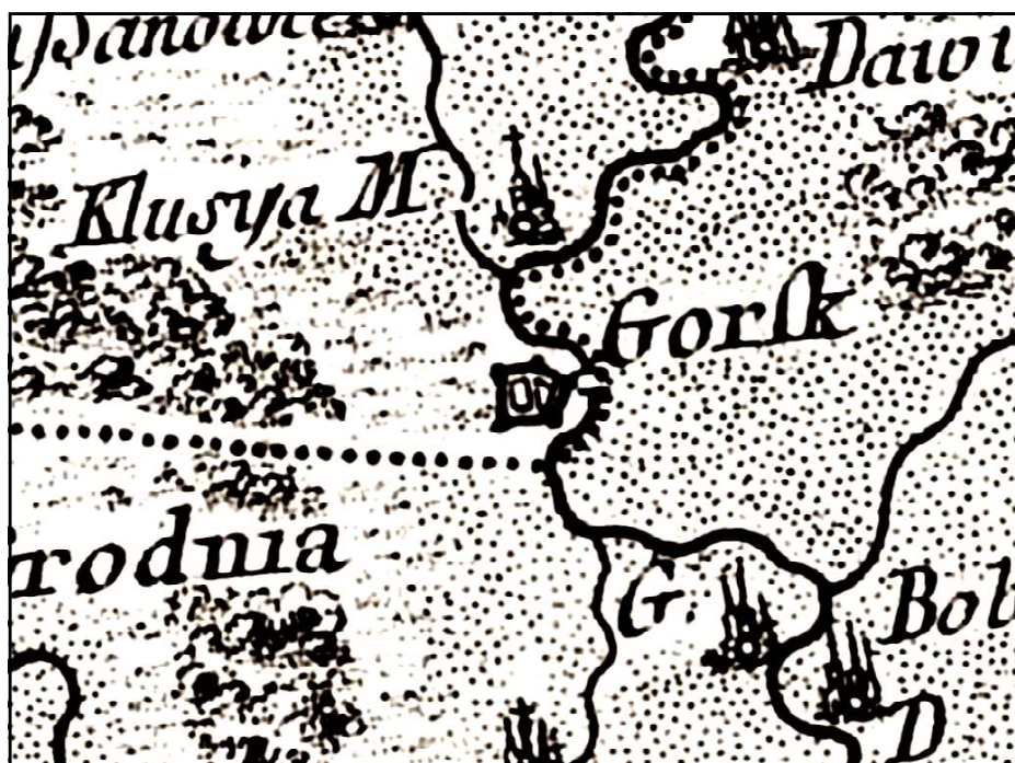
Рис. 2. Гірськ та Ключівський монастир на мапі 1772 р.

Згідно ж з писемними даними, вже наприкінці XV –на початку XVI ст., Гірськ нараховував близько 30 будинків, а це значить, що тут проживало близько 150–170 людей. У пізньосередньовічний та ранньомодерний час садиба господарів Гірська знаходилася також на місці старого городища. Саме ж городище згадується в документі 1620 р. окремо від населеного пункту, як таке що належало Борозднам. Загалом така практика, згадувати