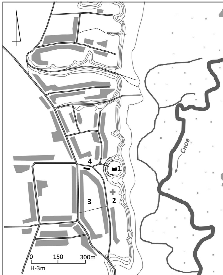
Рис. 1. План Гірська станом на 2021 р.: 1. Городище; 2. Миколаївська церква;

- цей населений пункт в своїй основі зберіг стародавню топографію і мережу вулиць, оскільки ніколи не розростався до великого урбанізованого поселення і не піддавався регулярним переплануванням.