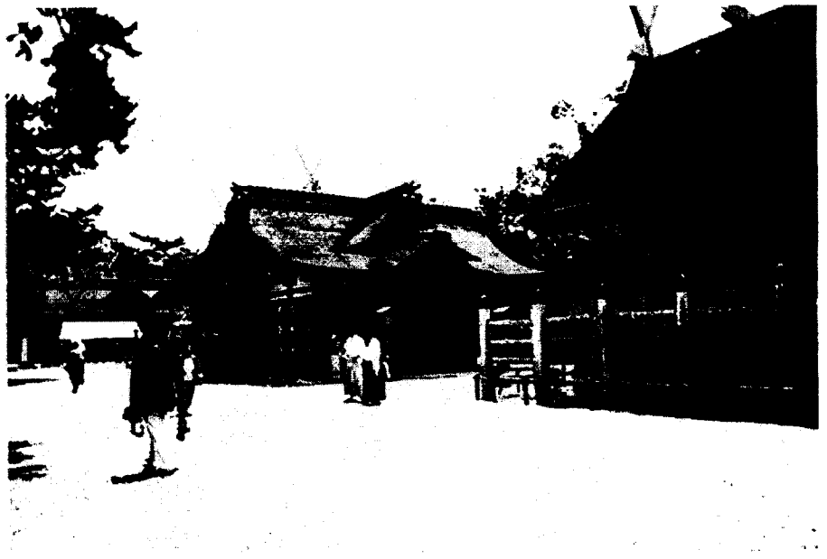
Рис. 1 Храм Сумійосі-тайся в м. Осака

На нинішньому етапі розвитку синтознавства актуальними стають дослідження не синто загалом, а окремих культів, напрямів, храмів. Саме такі студії можуть дати матеріал для розв'язання проблем, що постали перед синтознавством і, ширше, японознавством сьогодні. Якщо в Японії подібні дослідження вже проводилися в минулому, то для зарубіжних дослідників такий підхід відносно новий. Храм Сумійосі-тайся в м. Осака, про який йдеться в цій статті, не лише одна з чільних святинь синто, а й, як буде показано