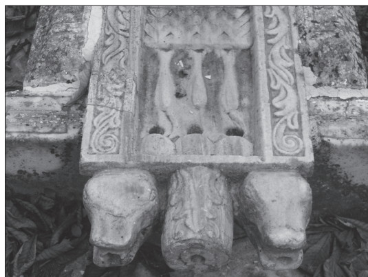
Іл. 5б. Фонтанний двір Бахчисарайського палацу. Фрагмент лотка зі зливом.