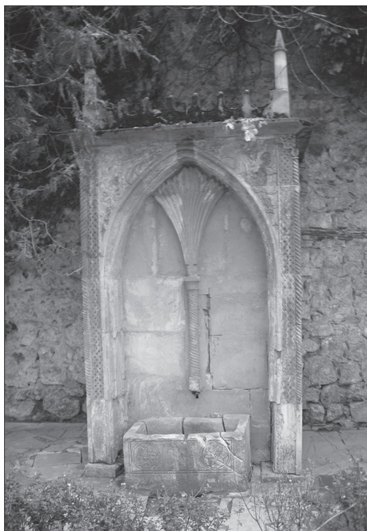
Іл. 2. Питний фонтан XVII–XVIII ст., встановлений в посольському дворіку Бахчисарайського палацу.