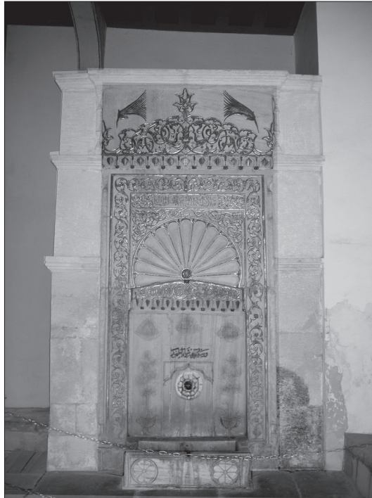
Іл. 7. Золотий фонтан – Манзуб. XVIII ст. Бахчисарайський палац.