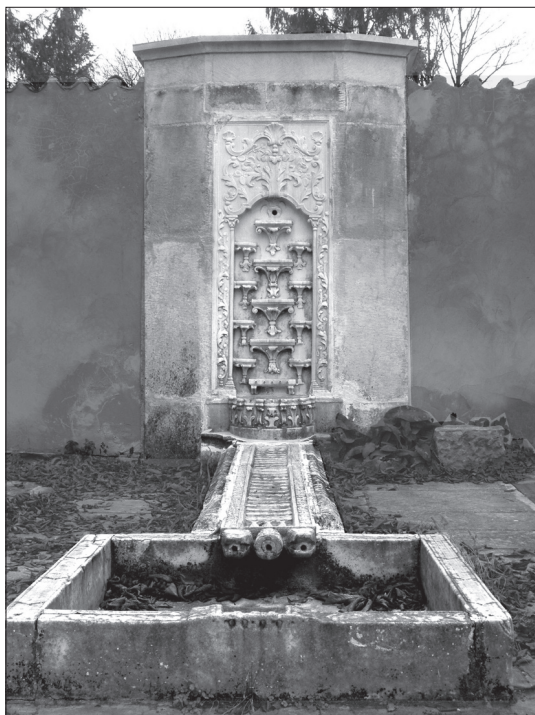
Іл. 5а. Фонтанний двір Бахчисарайського палацу. Фонтан із двома басейнами.