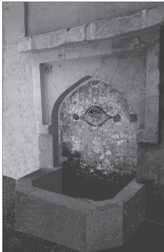
Іл. 4. Фонтан «Блакитне око» у Коккозах. XIX ст. Архітектор Н.П. Краснов.