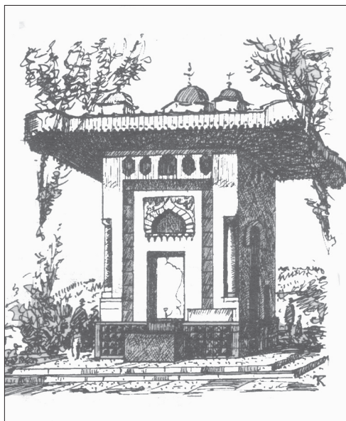
Іл. 3. Фонтан Айвазовського. 1888 р. Феодосія.