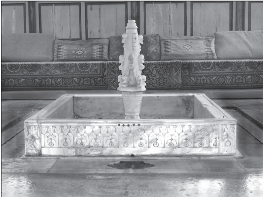
Іл. 6. Фонтан XVII–XVIII ст. у літній альтанці (Альгамбре) Бахчисарайського палацу.