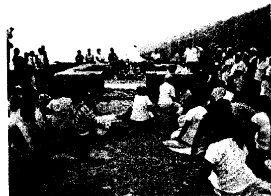
Вшанування гори Грідха кута